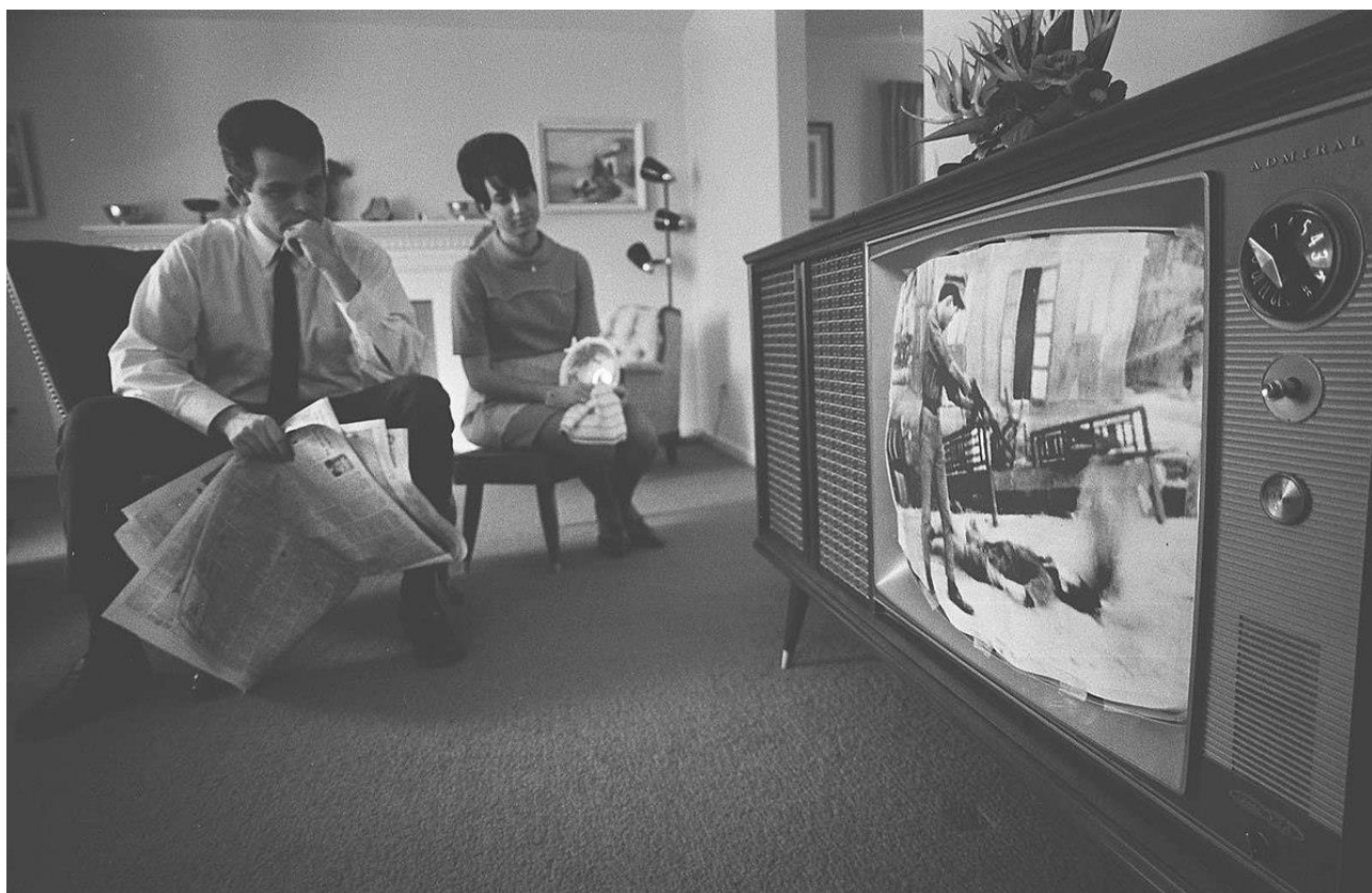
Bild 1. Kriget i Vietnam var för många uttryckligen en konflikt som nådde befolkningen över tv.