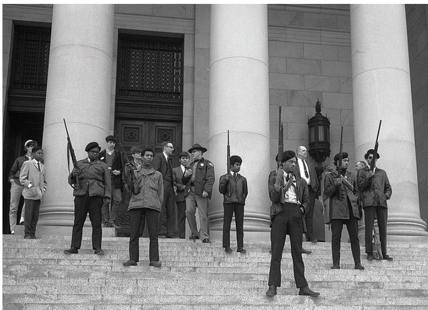
Kuva 1. Mustien pantterien mielenosoitus.

Yhtä selvää on, että 1960-luvun tapahtumista ei voi puhua vallankumouksena muuten kuin metaforan tasolla tai kapeammassa merkityksessä. Aikakausi kuitenkin tuotti useita vallankumousta ajavia ja vallankumoukselliseen ideologiaan nojautuvia ryhmiä ja liikkeitä. Vallankumous oli siis keskeinen käsite, ja Mustat pantterit oli tässä mielessä, omin termein ja tavoittein ymmärrettyinä, ”vallankumouksellinen” mobilisaatio.