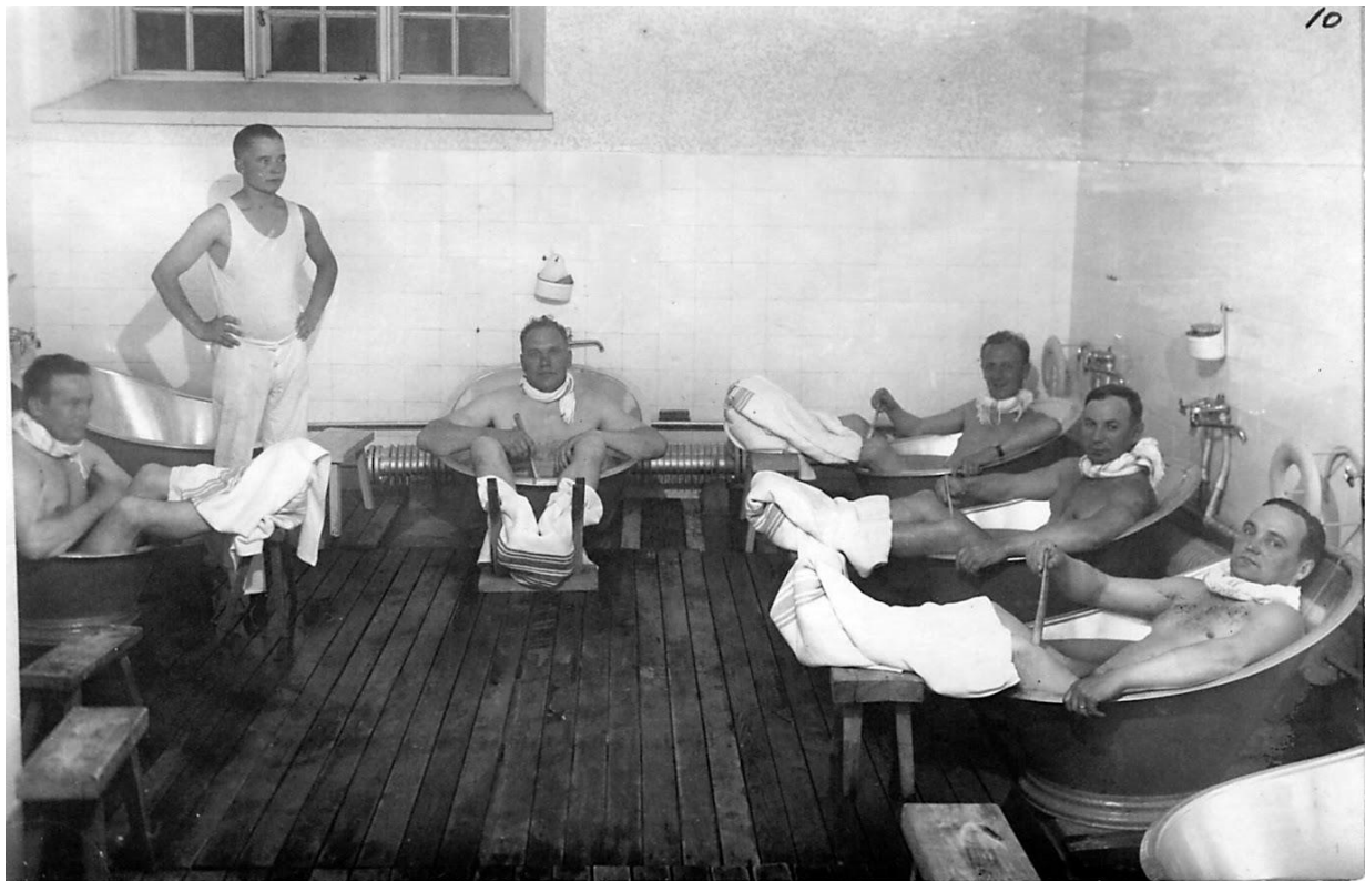
Kuva 1. Kubne-kylpijöitä Kirvun luonnonparantolassa todennäköisesti 1930-luvulla.

Teollistumisen, kaupungistumisen ja niiden esiin nostamien yhteiskunnallisten ongelmien vastareaktiona Keski-Euroopassa oli jo 1800-luvun kuluessa alkanut voimistua pyrkimys palata takaisin luontoon, mitä tavoiteltiin esimerkiksi luonnonparannustavan, vegetarismien, nudismin, puutarhakaupunki-ideologian, maa uudistuksen, pukeutumisen uudistamisen, patikoinnin tai ihannesiertokuntakokeilujen ympärille rakentuneiden yhteiskunnallisten liikkeiden kautta. Erityisen voimakas tämä suuntaus oli Saksassa, jossa näitä liikkeitä alettiin kutsua kokoavalla termillä elämänuudistusliike.