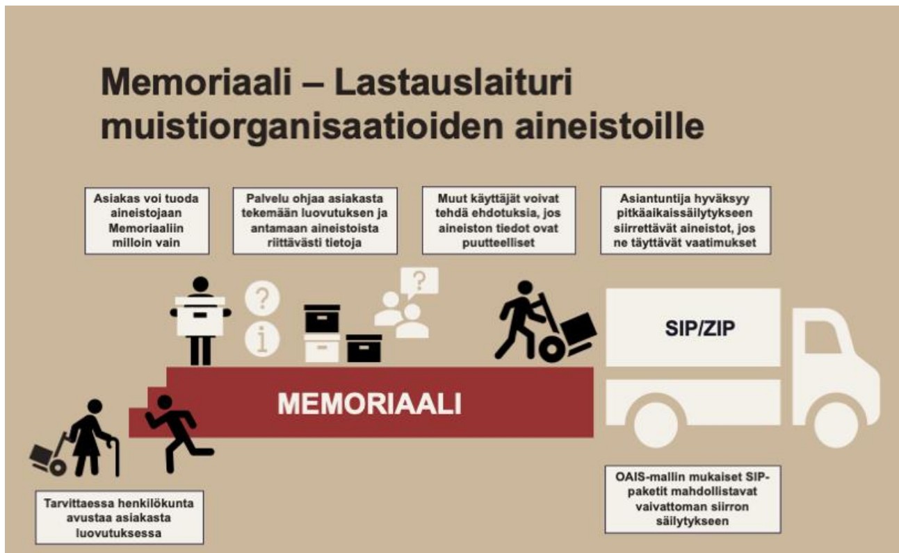
Kuva 2. Memoriaali toimii lastauslaiturina, jonka kautta aineistoa on mahdollista tuoda tallennettavaksi, muokata ja siirtää pitkäaikaissäilytykseen arkistovaatimukset täyttävien sip- tai zip-pakkausten avulla.

Memoriaalia käyttävä muistiorganisaatio hyväksyy palveluun tallennettuja aineistoja osaksi kokoelmiaan oman tallennuspoliittisen ohjelmansa mukaan. Memoriaalin kautta aineistot on mahdollista siirtää pitkäaikaissäilytettäväksi ulkopuoliseen järjestelmään tietyin teknisin reunaehdoin. Memoriaali ohjaa käyttäjää kuvailemaan aineistot riittävällä tasolla luovutusta varten, minkä lisäksi järjestelmä tuottaa tarvittavat metatiedot, joilla varmistetaan aineistojen käytettävyys sekä ymmärrettävyys myös pitkäaikaissäilytykseen siirrettäessä. Memoriaali itsessään ei ole säilytyspaikka, vaan palvelun perusidea selitettiin hankkeen aikana lastauslaiturina, jonka kautta aineistoa tuodaan, otetaan vastaan ja siirretään säilytettäväksi (Kuva 2).