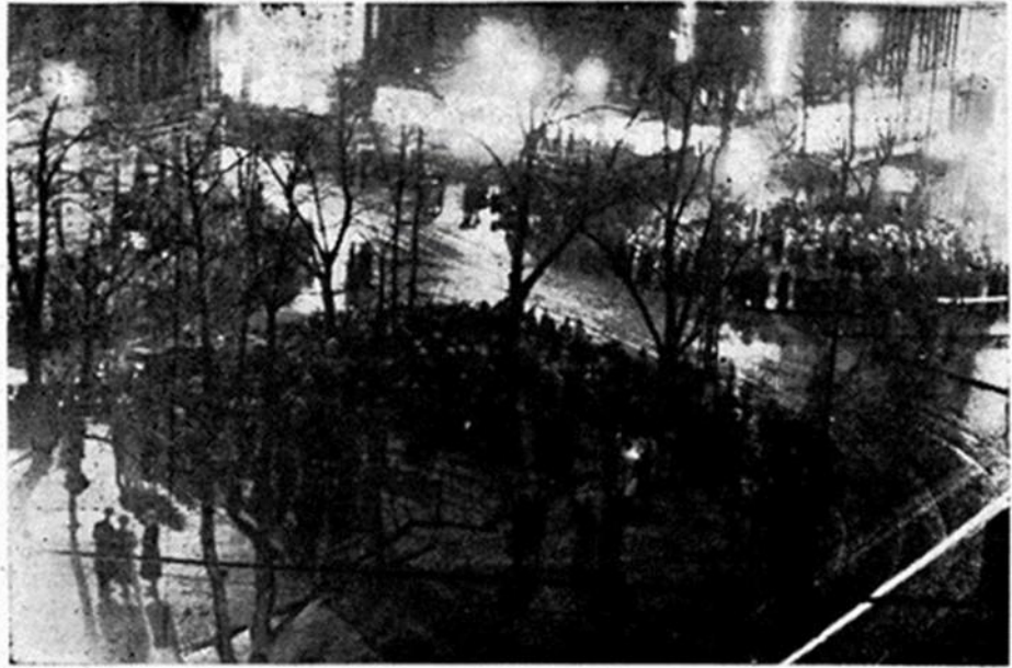
Tuokiokuva iltayöstä Heikinpuistosta.

Marraskuun 6. päivän iltana mellakat olivat kuitenkin todellisuutta. Helsingin keskustassa liikkeli tuhatmäärin ihmisiä, jotka eri tavoin osoittivat mieltään joko suomalaisuuden tai ruotsalaisuuden puolesta. Tämä tarkoitti huutamista, laulamista ja myös väkivaltaisuuksia. Samoin kuin edellisellä vuonna kaupungilla myytiin takinrinnoissa kannettavia messinkisiä suomalaisuuden ja punakeltaisia ruotsalaisuuden merkkejä.