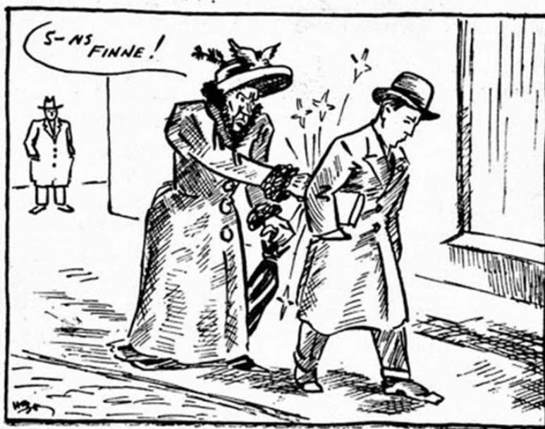
Kuva 5. ”Vaali-taisteluun” Ajan Suunta 7.11.1935.

osallistuivat ruotsalaiset eilen tavaksi tulleen katurähinöin. Sankarikuninkaan muisto kiihdytti niin vanhoja tätejäkin, että sanat eivät riittäneet, vaan piti siirtyä ”suoran toiminnan linjoille”. Milloinkahan suomenkielisille puolueille selviää, että suomalaisuuden aate on liian ylevä vietäväksi katurähinään?