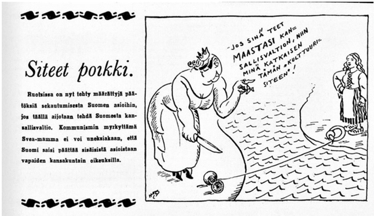
Kuva 2. "Siteet poikki" Ajan Suunta 17.11.1933.

vaalimenestys perustui osaltaan kokoomuksen kanssa tehtyyn onnistuneeseen vaaliliittoon, minkä seurauksena kokoomuksen paikkaluku väheni 42:sta 18:aan. Vaalien selkeä voittaja oli kuitenkin SDP, joka sai 12 lisäpaikkaa. Eduskuntavaalien tulos – maltillista politiikkaa harjoittaneen SDP:n paikkaluku kasvoi 78 edustajaan – osoitti, että suomalainen demokratia oli selviytynyt oikeistoradikalismin aiheuttamasta kriisistä. Vaalituloksesta huolimatta oli selvää, että niin kotimaan poliittiset muilutukset kuin eurooppalaiset esimerkit olivat tuoneet lainvastaisen väkivallan käytön yhdeksi keinoksi ajaa omia poliittisia päämääriä. Tästä yhtenä konkreettisena ilmenemismuotona nousi esille Helsingissä vuonna 1933 tapahtuneet ruotsalaisuuden päivän mellakat. 29