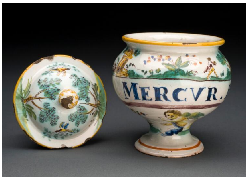
Kuva 2. Elohopeaa oli käytetty kupan hoidossa jo 1500-luvulta lähtien. Elohopeaa markkinoitiin useissa eri muodoissa, kuten voiteina, pillereinä ja nesteinä. Elohopean injektiohoidot otettiin käyttöön 1850-luvun puolivälissä. Kuvassa on italialainen elohopeapillerirasia 1700-luvulta.

Senaatti asetti vuonna 1888 tehtyjen lakialoitteiden vuoksi komitean tutkimaan voimassa olevia prostituution ja veneristen tautien määräyksiä. Komitea kokosi aineistoa piirilääkäreiltä, kaupungeista ja maalaiskunnilta. 54 Komitea pyysi lausuntoa myös Suomen Lääkäriseuralta. Seuran antaman lausunnon mukaan prostituution valvominen oli tarpeen, sillä ”Olisi sulaa hulluutta - - lakkauttaa suuremmissa kaupungeissamme nykyään voimassa olevaa ohjesääntöisyyttä, ellei voida muita tehokkaita toimia panna sen sijaan.” 55 Prostituutiokomitean mietintö valmistui vuonna 1891. Komitean lausunnon