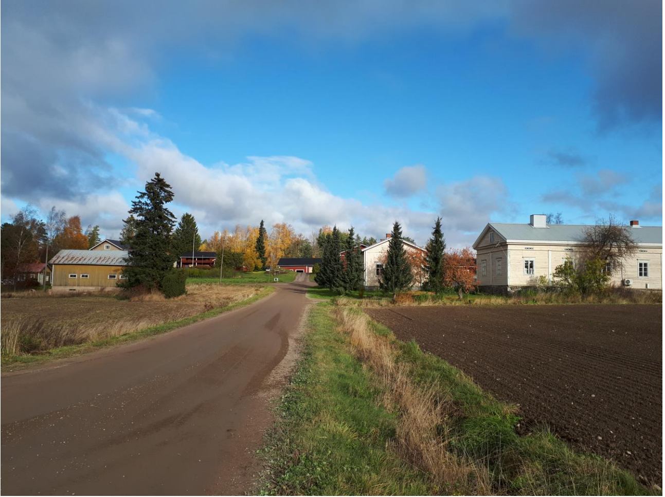
Kuva 2. Etualalla Vännilän Brusilan rakennukset paikalla, jonne talon tontti muutettiin 1800-luvun alkupuolella, taustalla Mattila.

elättää itsensä. Epämääräisempi ryhmä olivat sekalaisista lähteistä toimeentulonsa keränneet itselliset eli omassa ruokakunnassa eläneet mutta erikseen määrittelemätöntä työtä tehneet henkilöt. Vielä 1700-luvulla pysyvään itsellisyyteen altisti vamman tai sairauden seurauksena alentunut työkyky. 38 1800-luvun jälkipuolella ryhmä koostui entistä enemmän puhtaasti maatyöläisistä, joita lähteissä nimitetään yksinkertaisesti työmiehiksi.