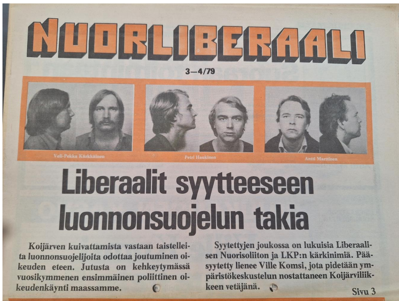
Kuva 3. Nuorliberaalijohtajien Kojjärvi-pidätyskuvia vuodelta 1979, KA

Nuorliberaalit eivät manifestissaan uskoneet erehtymättömiin oppi-isiin, vaan ajattelun ja arvostelun vapauteen. Asenteiden nähtiin kiristyneen niin oikealla kuin vasemmalla ja vapaamielisyyden joutuneen epäsuosiin, millä lienee viitattu nuortaistolaisten hallitseman Teiniliiton 1970-luvun puolivälissä paljastuneisiin raha- ja kokousvaltakirjasotkuihin sekä ajankohdan repivään nuorisopolitiikkaan. Nuorliberaalit halusivat muuttaa maailmaa hankkimalla tietoa, valistamalla ja toimimalla määrätietoisesti. Ihmisoikeuksiansa puolesta taistelevia sorrettuja oli tuettava väkivaltaa ihannoimatta, missä on nähtävä ero edellisessä ohjelmassa aseelliselle anti-imperialistiselle taistelulle osoitettuun periaatteelliseen tukeen ja paluu hiljalleen uuteen nousuun lähteneeseen sitoutumattomaan pasifismiin ja kehitysmaasolidarisuuteen. 44