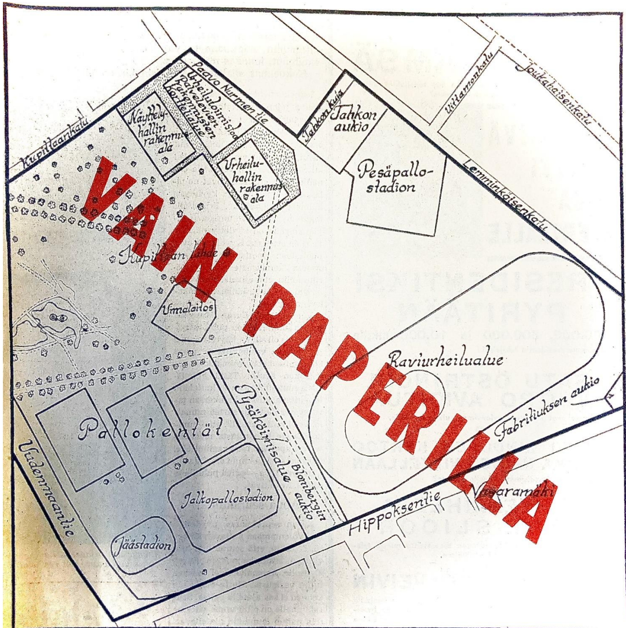
Kuva 1. Liikuntapaikkarakentaminen oli 1960-luvulla osa kuntien välistä vetovoimakilpailua. Turun urheilulaitosten rakennussuunnitelman käytännön toteuttamista jouduttiin odottamaan pitkään. Turun Sanomat arveli suunnitelman toteutuvan "vain paperilla". Turun Sanomat 16.11.1967.

Samaan aikaan kun kaupungin ulospäin näkyvä kilpaurheilu ja sitä tukeva rakentaminen herättivät huomiota, koettiin kuntourheilussa nostetta. Kuntourheilun varsinaiseksi esiinmarssiksi Kuva 1. katsottiin Turun ja Tampereen välinen kävelyottelu vuonna 1964. Tämän tempauksen koettiin vahvistaneen kuntourheilun asemaa sekä SVUL:n että TUL:n Varsinais-Suomen piireissä ja sen myötä kuntourheiluun alettiin käyttää aiempaa enemmän resursseja. Järjestötasolla kävelyottelua kuvattiin ensikädessä urheiluseurojen, koulujen, yhdistysten ja ennen kaikkea kansalaisten yhteiseksi ponnistukseksi. Kaksi kuukautta kestäneen ottelun aikana turkulaiset kävelivät yhteenlaskettuna 100 000 kilometriä päivässä, yhteensä koko ottelussa noin 150 kertaa maapallon ympäri. 33