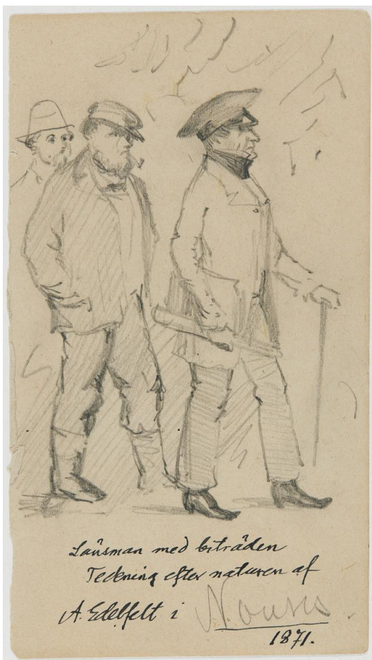
Kuva 1. Albert Edelfelt, piirros. Nimismies ja apulainen. 1871. Museoviraston kokoelmat.

Kaupunginviskaalin apuna valvomassa järjestystä kaupungeissa, joissa ei vielä ollut poliisia, toimi erilaisia miespartioita. Näiden tehtävä oli vahtia järjestystä ja pitää silmällä mahdollisia tapahtuneita rikkeitä ja rikoksia. Mikäli sellainen tapahtui, lähetettiin sana viskaalille, joka saapui paikalle viipymättä. Henkirikostapauksen tultua ilmi lähetti viskaali sanan edelleen kaupunginlääkärille, joka saapui paikan päälle toteamaan tilanteen ja saattoipa tämä jo lausua kuolinsyystä jotain, jos se ruumiista kävi selkeästi ilmi. Kaupungeissa kuulustelut, joita johti kaupunginviskaali, pidettiin yleensä heti, mikäli vuorokaudenaika antoi siihen mahdollisuuden. Joskus kuulustelut pidettiin jopa myöhään illalla, jotta silminnäkijöiden havainnot saataisiin mahdollisimman pian talteen ja tekijä telkien taakse. Mikäli asiayhteydessä ilmaantui selkeä epäilty, toimitti kaupunginviskaali hänet vankilaan odottamaan lisäkuulusteluja ja oikeudenkäyntiä. Kuulusteluista kirjattiin todistajien, silminnäkijöiden ja mahdollisen epäillyn lausunnot ylös. Edelleen tämä asiakirja luettiin tiedoksi suoritetuista kuulusteluista ensimmäisessä