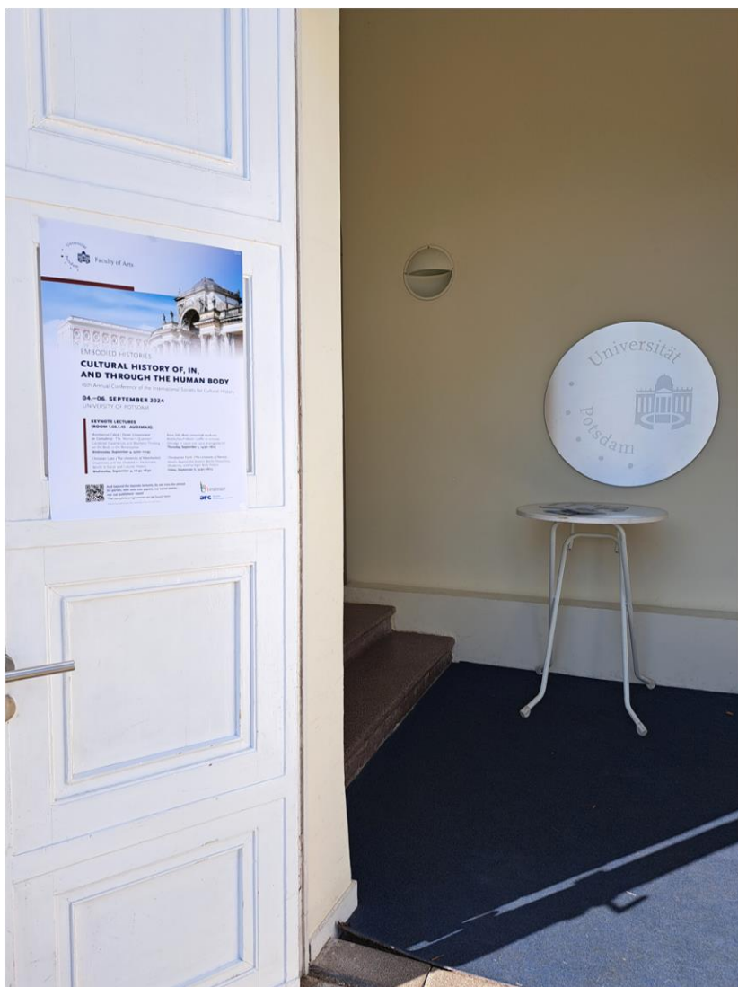
Kuva 2. Konferenssijuliste yliopiston auditoriorakennuksen ovesa.

ISCH-konferenssin teema oli tällä kertaa ruumiillisuuden kulttuurihistoria. Otsikko Embodied histories: cultural history of, in, and through the human body (Ruumiillistetut tarinat: kulttuurihistoria ihmiskehosta, -kehossa ja -kehon kautta) piti sisällään monenlaisia näkökulmia ihmiskehon kulttuurihistoriaan. Osallistujia oli yli 200 eri puolilta maailmaa. Suomalaiset ovat olleet perinteisesti innokkaita ISCH-konferensseissa kävijöitä, ja maastamme oli myös Potsdamissa vahva edustus.