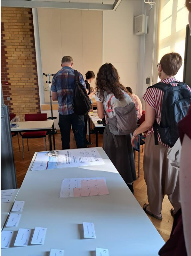
Kuva 3. Ilmoittautumisjono oli pitkä.