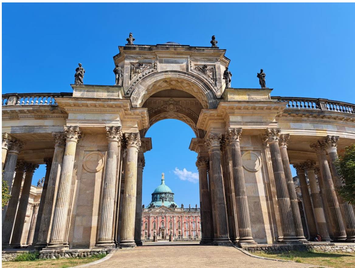
Kuva 1. Neues Palais kampusalueelta katsottuna.

Kuudestoista vuosittainen Kulttuurihistorian kansainvälisen seuran (International Society for Cultural History eli ISCH) konferenssi järjestettiin 4.–6.9.2024 Potsdamissa, Saksassa. Sää suosi konferenssivieraita, sillä lämpötilat olivat koko tapahtuman ajan jopa poikkeuksellisen helteiset vuodenaikaan nähden. Myös konferenssipaikka oli kulttuurihistorioitsijoille mieluinen – Potsdamin yliopiston kampus, jossa konferenssi pidettiin, sijaitsee Unescon maailmanperintökohteen, historiallisen Sanssoucin puiston laidalla. Aivan yliopistorakennusten vieressä kohoaa Neues Palais, 1760-luvulla