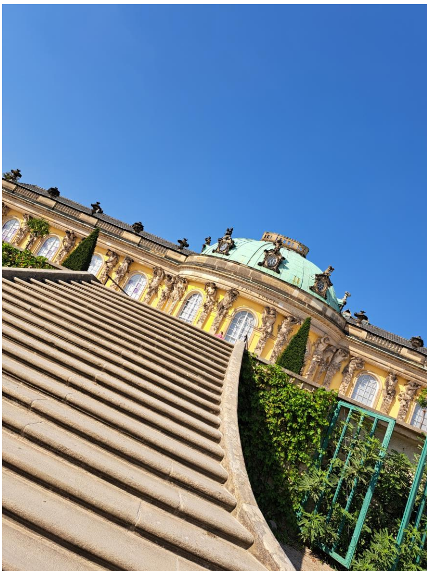
Kuva 5. Sanssoucin palatsi.

Heti ensimmäisenä iltana oli ohjelmassa konferenssi-illallinen. Se järjestettiin samassa paikassa, jossa moni konferenssin osallistuja oli jo aiemmin päivällä syönyt lounasta, eli paikallisessa opiskelijaruokalassa Mensassa. Tämä oli poikkeuksellinen ratkaisu, eivätkä opiskelijaruokalan työntekijät varmasti saa usein valmistettavakseen kolmen ruokalajin illallista. Lämpimässä illassa oli kuitenkin mukavaa istuskella ulkona Mensan pitkien terassipöytien ääressä, jonne konferenssiväki oli levittäytynyt, tutustua uusiin ihmisiin ja jatkaa juttua vanhojen tuttujen kanssa. Illan päätteeksi kävelyretki pimeään Sanssoucin puiston läpi tarjosi jännitystä, mutta löysimme kävelyseurani kanssa lopulta tien ulos puistosta, jossa ei yllättävästi ollut minkäänlaista iltavalaistusta.