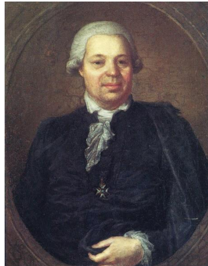
Kuva 5. Prokuraattori Matias Calonius.