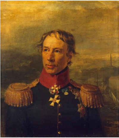
Kuva 1. Kenraalikuvernööri Fabian Steinheil.