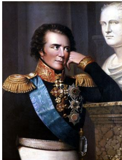
Kuva 4. Vt. kenraalikuvernööri Kustaa Mauri Armfelt.