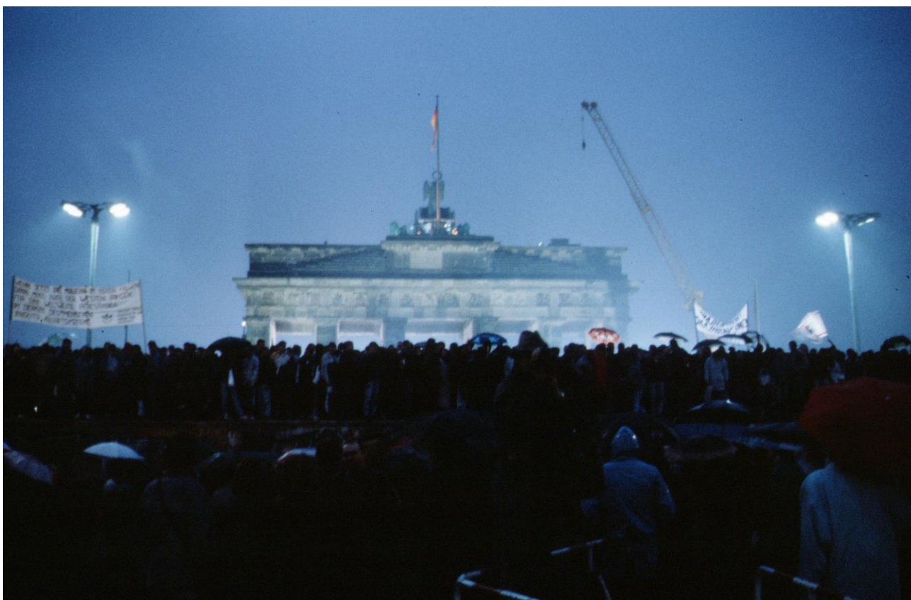
Berliini loppuvuonna 1989.

Vaikka saksalainen kansallisuusaate ei ehkä herättänyt huolta, niin yleisesti kansallisuuskysymykset nostivat tummia pilviä odotushorisonttiin. Vuoden 1989 aikana Itä-Euroopan maiden kansalaiset nousivat Neuvostoliittoa ja kommunistista hallintoa vastaan, 47 ja seuraavan kahden vuoden aikana Baltian neuvostotasavallat pyrkivät kohti itsenäisyyttä. Kuten historiantutkija Osmo Jussila kirjoitti vuoden 1989 alkupuolella: kevät oli saapunut Euroopan kansoille. Tässä kehityksessä Jussila näki kuitenkin verenvuodatukselta täyttävän tulevaisuuden: ”Euroopan pirstominen kaikkiin niihin kansallisvaltioihin, joita pienet kansat sen eri puolilla haluaisivat, – – olisi suuri onnettomuus ja vaatisi kaiken lisäksi sotia sekä paljon verta”. 48 Itä-Euroopan tapahtumat ja kansallisuusaatteen nousu muodostivatkin monelle suomalaiselle Euroopan tulevaisuuden ”vakavimman turvallisuusuhan”. 49