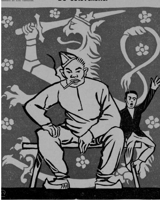
Kuva 2. Itsenäistymisen ja sisällissodan jälkeen ajankoh- taistuivat hallitusmuoto- ja itsehallintokysymys sekä pe- rustuslain tasolla kirjattava ruotsin kielen asema. Suo- menkielisten pelätyn ”isäntävallan” demokratiassa katsot- tiin vetävän Suomea etäämmäs Skandinaviasta ja horjut- tavan näin perinteistä yhteyttä suomalaisen sivistyksen al- kuperään, Ruotsiin. Kuvan mongolisin piirtein varustettu flegmaattinen suomalainen edustaa pitkäkestoisia näke- myksiä suomalaisista mongolisina kansoina. Hovnarren 6.11.1920.

Tutkimassani Suomen ruotsalaisten identiteetti-prosessissa huomioni on kiinnittynyt pikemminkin yleiseen mielikuvaan kuin yleiseen mielipiteeseen. Walter Lippmanin mukaan yksilön toiminta ja intressi liittyvät mielikuviiin, jotka ovat useimmiten yksinkertaistuksia todellisuudesta ja useasti stereotyyppisiä. Tutkimus on osoittanut mielikuvien olevan pitkäikäisiä, ruokkivan usein itse itseään ja olevan myös vastustuskykyisiä faktoille. Historiantutkimuksen tehtävä on tutkia, miten jokin mielikuva on päätyneet vallitsevaksi. Aineistoni on avannut näkymän Suomen ruotsinkielisten pitkäkestoisiin ja toistuviin mielikuviiin suomalaisista, mitä ruotsalaisuusliikkeessä esiintyi. Amos Anderson nousi kansanedustajana yhteistä Suomea hajottavia kuvia vastaan vuonna 1924 haastamalla ääri-ruotsalaista nationalismia, kuten hän luonnehti puolueessaan vaikuttavia voimia. Andersonin esittämä tiekartta molemman kieliryhmän Suomesta oli kuin väläys vuoden 1900 Pariisin paviljongin ideasta: rakennelmassa on ainekset läntisen arkkitehtuurin historiasta, sisällössä suomalaisen hengenelämän saavutuksia. Se valaisi tietä ulos umpikujasta, pesäerosta ja erillisestä Svensk-Finlandista .