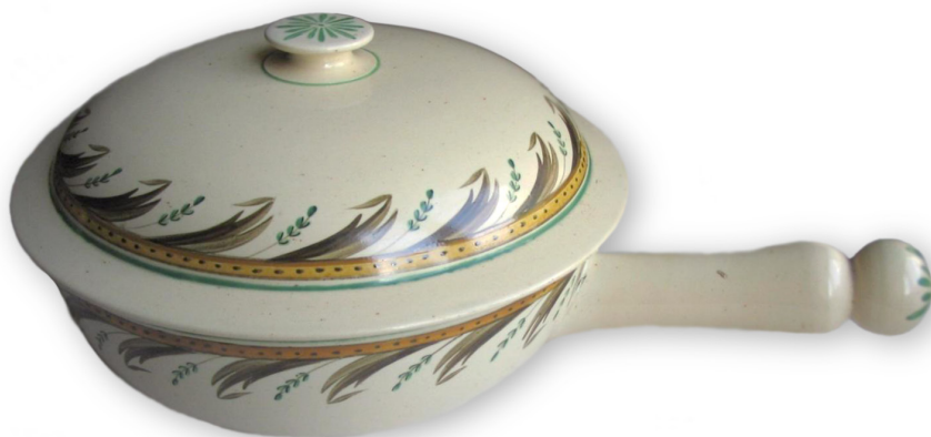
Bild 4. Terrin ur Rörstrandsservis. Frugårds museum.

I detta avlägsna hörn av Europa, där adelsmännen klänger sig vid jorden och handhar för landet viktiga ärenden, utgör således familjen en enhet som fortfarande är betydelsefull på 1700-talet. På den tiden utgjorde adelsfamiljen den centrala konsumtionsenheten eftersom ”kulten av familjens status” dikterade att denna konsumtion skulle sträcka sig över generationerna. ”En generation köpte varor och ting som skulle representera och förhöja den ära som tillkom föregående generationer och som i sin tur bildade fundamentet på vilket de kommande generationerna skulle resa sina äreminnen. Köpet avgjordes ”av