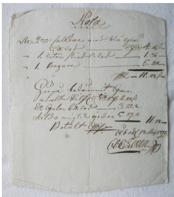
Bild 3. Nota 5. Nota över tvenne saltkar med blå glas köpta i Åbo 13.5.1797. Frugårds museum.

Det verkar vara fråga om privata nätverk, där vissa handelsmän och deras mellanhänder prefererades. Klart var dock att både handelsförbudet på landsbygdens bröts och uppköp gjordes i ”främmande land”, Ryssland. Det tyder på att konsumtionen var så pass viktig att man tog sig egna friheter.