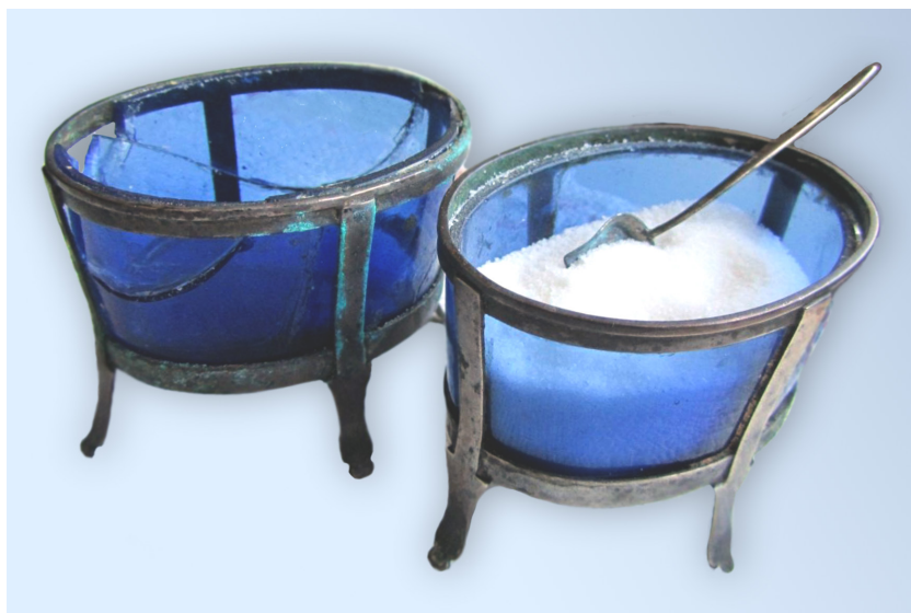
Bild 2. De två saltkaren 3.3.2012. Frugårds museum.