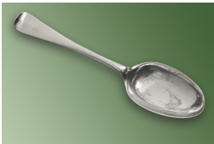
Figur 4. Matsked av silver tillverkad i ett stycke av Johan Wittfoth år 1743 i Åbo (längd 20,5 cm). De "8 D:o gjorde av Witfoth" som noterats i bouppteckningen efter Magister Johan Grå (bu 30) kanske var av den här typen.

Man kan notera att här upptas en skillnad mellan manligt och kvinnligt gällande skospännen, någonting som annars inte är vanligt i uppteckningarna förutom när det gäller kläder och här är det ju också dräktdetaljer det är fråga om. Men mer typiskt för vanliga rusthåll är kanske förteckningen över silverföremål i uppteckningen efter rusthållsvärdinnan Maria Johansdotter från Kurjalax kronorusthåll i Tövsala 1762. I den här bouppteckningen finns inga guldföremål: 35