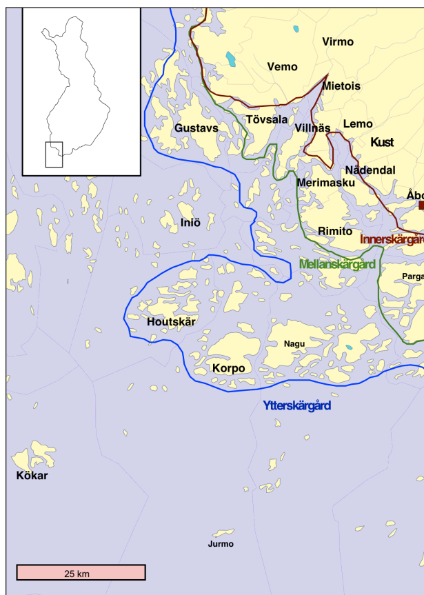
Figur 1: Undersökningsområdet i Åbolands och Ålands skärgård.

Vad gäller situationen på 1700-talet finns det en relativt noggrann genomgång av böndernas hushåll med koncentration på inredning, köks- och andra kärl i Saini Laurikkalas doktorsavhandling ”Varsinais-Suomen talonpoikain asumukset ja kotitalousvälineet 1700-luvulla. Kulttuurihistoriallinen tutkimus” från 1947. Laurikkala går med stor noggrannhet igenom bondhushållens möbler, redskap och utensilier i 1700-talets bouppteckningar och redogör i det sammanhanget också för en del av ädelmetallerna, närmast silverkärlen. Jag har använt mig av hennes texter för jämförelser och kompletteringar. Jag använder delvis samma bouppteckningsmaterial som Laurikkala, men mitt material sträcker sig längre ut i skärgården och ca hundra år längre fram i tiden. 7