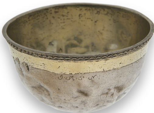
Figur 3. Tumla eller tumlare med förgylld kant, tillverkad av Jonas Lexell i Åbo år 1751 (diam. 6,5 cm). Tumlarna användes ofta till att dricka brännvin med och kunde också förses med tumgrepp eller öra.

En ny grupp föremål som finns i bouppteckningarna på 1800-talet är de silverbeslagna tobakspiporna. 1700-talets kritpipor som var en dåtida dussinvara ersätts av mer påkostade rökverk. Det är fråga om praktföremål med piphuvuden av sjöskum eller trä, och med lock och beslag av silver och långa böjda skaft av trä, ben, tyg och läder. 29 Det gällde för en välbeställd gård att ha ett urval i piphyllan som räckte också för gästerna. Det är vid en sådan piphylla som Malakias Härkämäki tar flera tiotal sidor på sig för att välja ut en lämplig pipa i