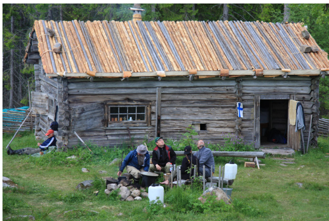
Till vänster: Nävertaket på Käckåsens rökstuga läggs sommaren 2009. Foto: Arpad Sailo. Till höger: Rökstugans tak står färdigt. Foto: Arpad Sailo.

speciellt bland olika museer och kommuner. Under projektets gång inventerade man även skogsfinska byggnader och restaurerade bygganden speciellt i området Solör i Norge och norra Värmland i Sverige. Projektet resulterade i en slutrapport och en bok som behandlar över hundra skogsfinska besöksmål. 12