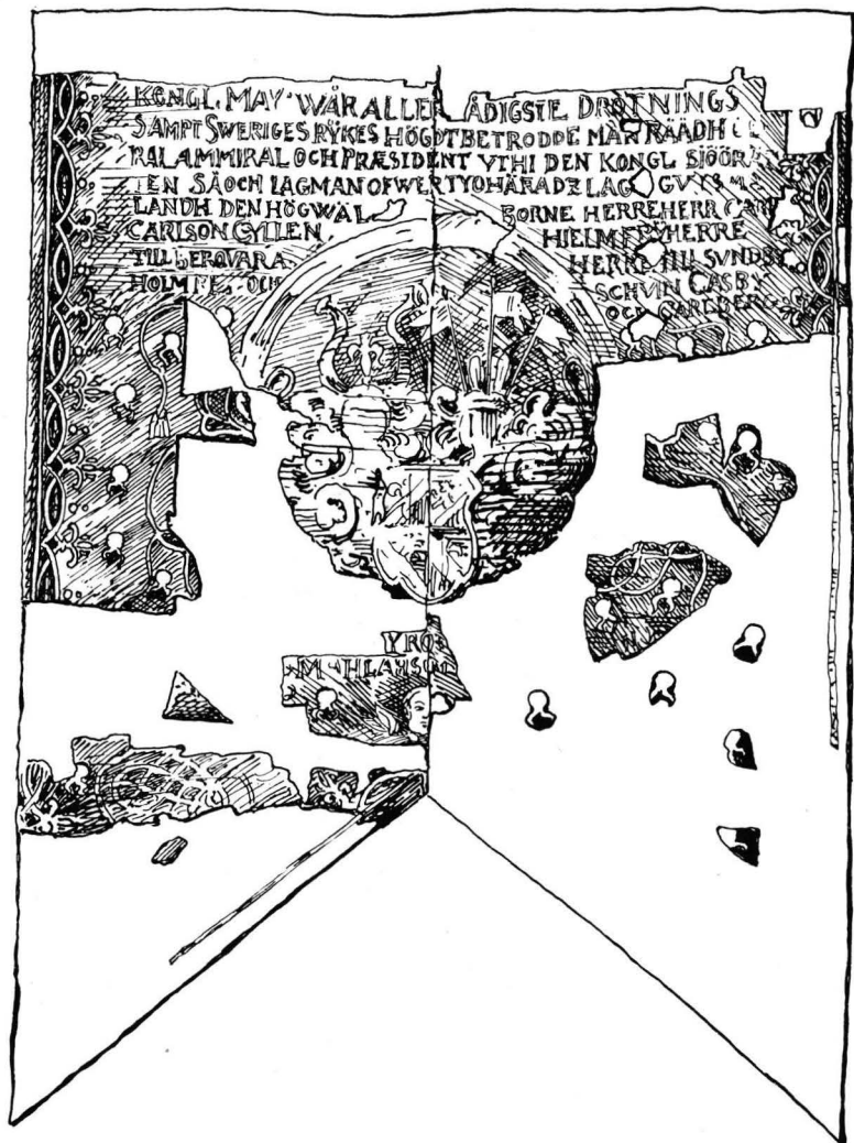
Carl Carlsson Gyllenhielms († 1650) begravningsbanér i Strängnäs domkyrka.