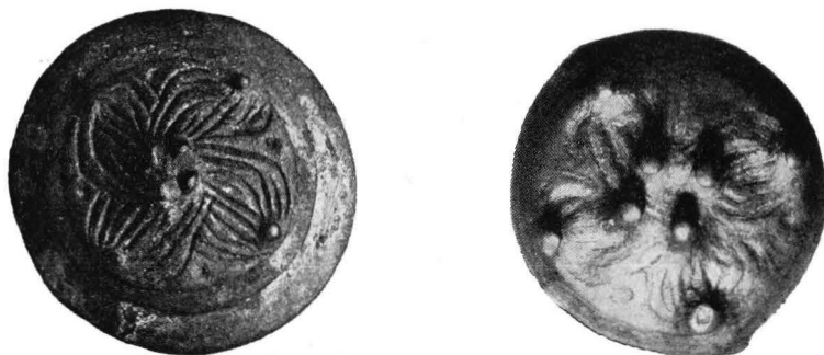
Fig. 5. Spännen av typ E. 1. Fole kyrkogård, Gotland \frac{2}{3} . 2. Borggården Hökhuvudssocken, Uppland. \frac{1}{1} .

Typ F är ganska väl representerad i Sverige. Från Gotland känner jag tre exemplar. År 1874 inkom ett spänne av denna typ till Statens historiska museum från Gervide i Sjunhems socken