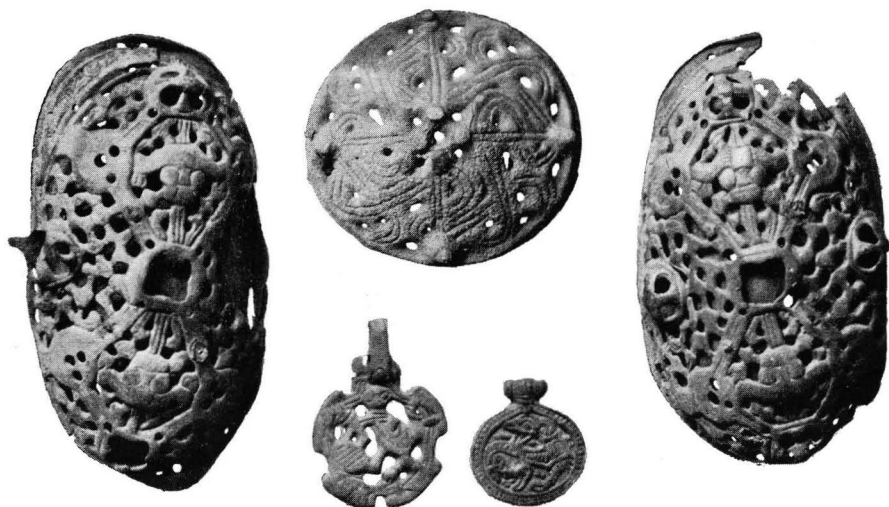
Fig. 3. Gravfynd från Malmberg, Kung Karls socken, Västmanland.

mitten av århundradet. (Jfr Sune Lindqvist, Birkamynten, Fornvännen 1926, sid. 324.) Det större, genombrutna hängsmycket är av typen Montelius, Sv. F. 607. Inom en oregelbunden ram är ett med fyra ben försett gripdjur i karolingisk stil inpassat. Även detta smycke, som är starkt nött, torde tillhöra förra delen av 900-talet. Det andra, mindre hängsmycket av typen Montelius, Sv. F. 596, visar innanför en pärlrand ett tillbakaseende djur i Jellingestil. Det bör alltså vara yngre än 900-talets mitt. Detta smycke är liksom ormspännet betydligt mindre nött än de övriga. Graven torde kunna dateras till 900-talets senare hälft.