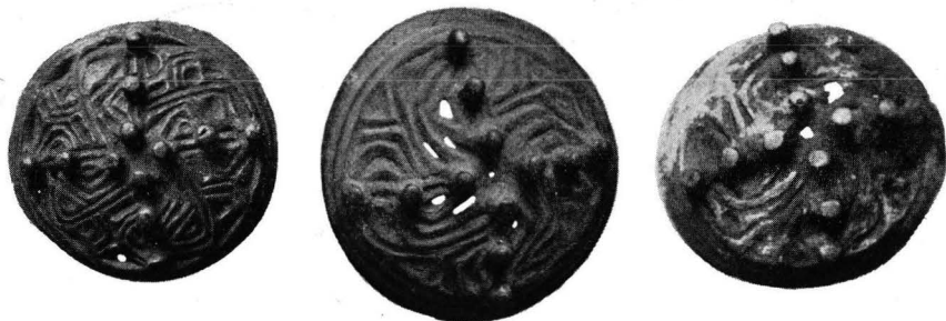
Fig. 6. Spännen av typ F. 1. Gervide, Sjöhemms socken, Gotland. 2. Västmanland? 3. Unna Saivva, Lappland. Omkr. \frac{2}{3} .

(fig. 6: 1, SHM 5265), möjligen ett gravfynd. 1 Ett annat anträffades i en åker vid Siffride i Fide socken (SHM 15297), och ett tredje är funnet vid Bopparve i Hemse socken utan att närmare fyndomständigheter blivit angivna (Gotl. Fornsal 1617). 2