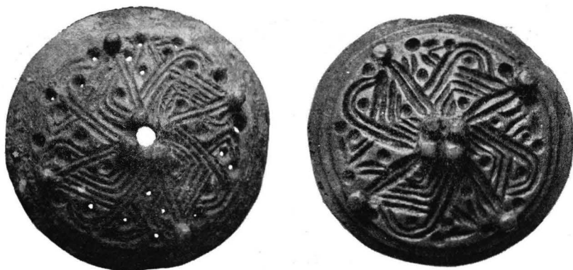
Fig. 4. Spännen av typ D. 1. Kräklingben sn, Gotland. 2. Unna-Saivva, Lappland.

två ormspännen, det ena av typ D (fig. 4: 2, SHM 15721: II: 34). Av de övriga fynden i samma lager att döma torde det ha nedlagts under 1000-talet.