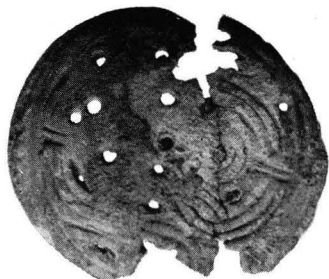
Fig 7. Kumla, Boglösa socken, Uppland. Omkr \frac{2}{3} .

Ett spänne av typ F anträffades av Bengt Thordeman 1919 i en grav vid Addarsnäs i Länna socken, Uppland (SHM 16311). Graven har beskrivits av Åke Stavenow i Upplands fornminnesföretidskr. VII, sid. 226 ff. (Från uppländska gravfält. V. Undersökningar vid Addarsnäs, Länna socken, Frötuna och Länna skeppslag), där