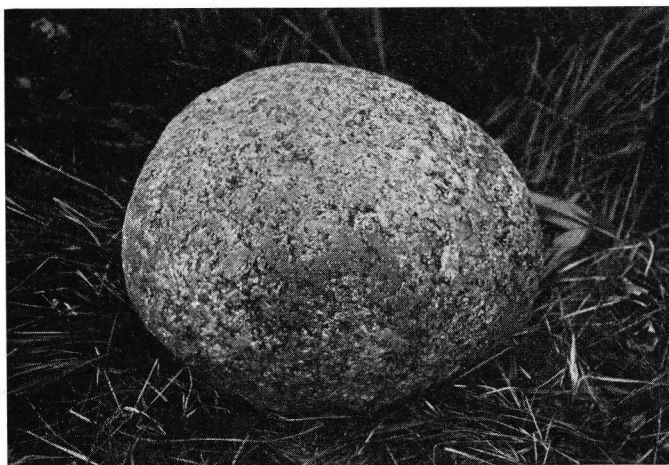
Avb. 4. Stenklotet från graven XXIII, Lågpeitkangas, Vörrå.

Dessa fynd av naturliga — utan något spår av ornering eller med inhuggna symboliska tecken försedda — stenklot i gravar på finländsk jord, leda våra tankar till de ofta rikt ornerade, klotformiga kultstenar, som äro kända från förhistoriska gravar i både Sverge och Norge, medan äggformiga dylika torde vara kända från Danmark. De svenska stenklotens utbredningsområde omfattar huvud-