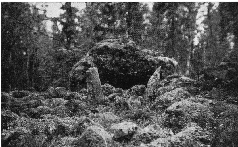
Avb. 1. Två av bautastenarna på röset å Viskusbacken, Vörå.

1932 tillsammans med dr. Äyräpää besökte röset. På dess högsta punkt växer en ganska stor björk, som omedelbart ovanför rösytan grenar sig i flere armar, och bautastenen står strax under förgreningsstället, omsluten i ett hårt famntag av en mer än armtjock rot. Den är synlig blott från ett håll. De tre bautastenarna ha, räknade från S—N, följande dimensioner. N:o 1, som är nästan rektangulär: höjd över rösytan 0,8 m, bredd på mitten 0,4 m, tjocklek på mitten 0,13 m; n:o 2, som slutar i en vass spets och står i något lutande ställning: höjd 0,75 m, bredd 0,3 m, tjocklek 0,08 m; n:o 3: höjd 0,83 m, bredd 0,27 m, tjocklek 0,25 m.