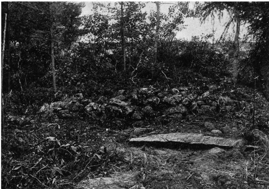
Avb. 2. Stempelaren in situ i graven XVII, Lågpeltkangas, Vörå.

Lågpeltkangas i Koskeby, Vörå. 1 Sommaren 1924 undersökte jag på detta gravfält en liten plan stensättning (XVII), vilken innehöll såväl vapen som gravgods, hörande till en kvinna. Vid sydvästra kanten av stenplanen anträffades i liggande ställning en lång, smal stempelare, täckt av ett mycket tunt jordlager. Pelaren, som avsmalnade mot bägge ändarna, mätte i längd 1,85 m samt 0,32 m. på det bredaste och 0,26 m på det tjockaste stället (avb. 2). Graven hade inte anlagts på platsen för likbålet, enär blott obetydligt kol och endast en större