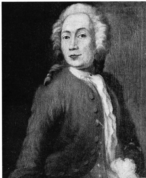
Avb. 6. Okänd. Åbo Museum.

Till uppställning och typ erinrar det sannolikt på 1690-talet utförda porträttet icke så mycket om Ehrenstrahl som om dennes systerson, elev och efterträdare David von Krafft. Men många drag äro