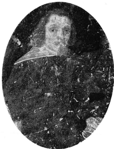
Avb 1. Michael Wexionius. Åbo Museum

Ett annat porträtt av Michael Wexionius har tidigare varit bekant, ett kopparstick från 1650, av vilket ett exemplar finnes i Kungliga Biblioteket i Stockholm (avb. 2). Det är mycket valhänt i teckningen och i synnerhet ansiktsformen med dess sluttande panna och framträdande käkparti synes föga överensstämma med vårt por-