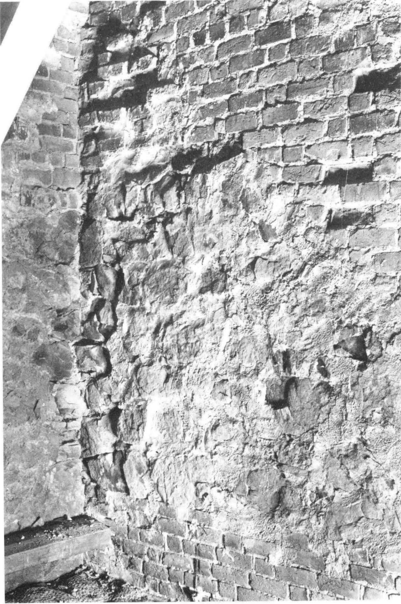
Bild 3. Detalj av samma ställe som avbildas i bild 2. Till vänster tornet, i bildens mitt det äldsta långhusets västra gavel. Gavelns översta av gråsten murade del är lagd i förband med gråstensmuren i tornet, tydligen för att förankra tornet i gaveln. Nedtill tegel i munkförband. Tegelytan löper stumt in under tornmuren, vilket visar att ytan är en del av långhusets ursprungliga tegelfasad. — Foto P O Welin 1979.