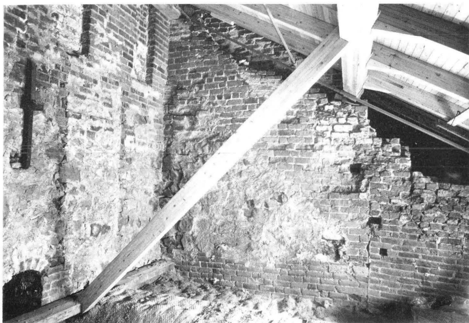
Bild 2. Vinden ovanpå Sta Ursulas kapell (nr 1 på planen). Till vänster tornet, till höger det äldsta långhusets västgavel och sydvästra hörn. Nederst ses ursprunglig väggyta av tegel i munkförband, däröver den översta av gråsten murade delen, som är lagd i förband med tornets gråstensmur till vänster. Tegelmurningen ovanpå gråstenspartiet är av yngre datum.

dras in i diskussionerna om Åbo domkyrka, samt Gothems kyrka på Gotland. På grund av funktionella förändringar kom sakristian in i bilden först under senare hälften av 1200-talet. Det här kände man inte till på den tid då Rinne skrev sin version av domkyrkans historia, men numera är förhållandet klarlagt. Det är därför helt meningslöst att försöka påstå att den lilla första sakristian i Åbo skulle vara "från början av 1200-talet" 16