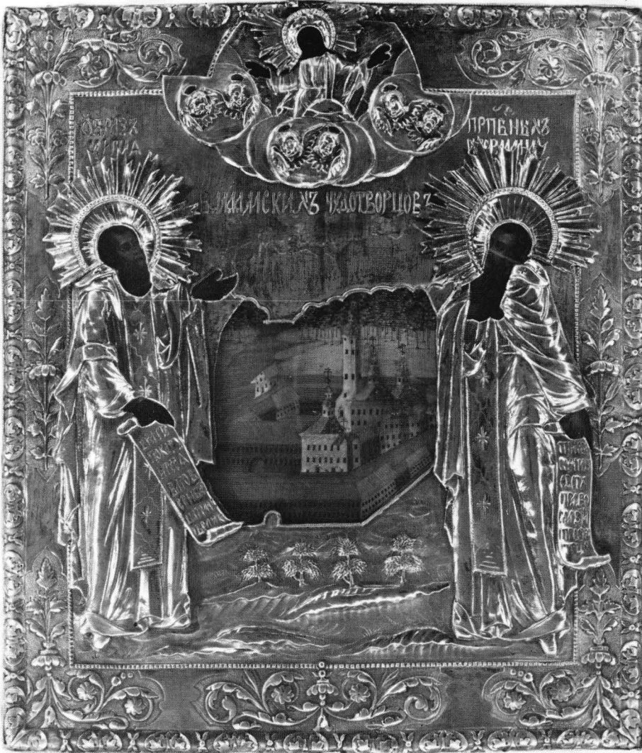
Fig. 3. Klosterbyggnaderna från igumenen Nazarijs tid dominerade omkring hundra år ikonerna av Valamos grundare. Slutet av 1700-talet. OKM 1515. Foto Vesa Takala. Ortodoxa kyrkomuseet.

tar dateringen av ikonerna. Bara vi alltså håller huvuddragen av klostrets byggnadshistoria i minnet, är det enkelt att undvika dateringsmisstag.