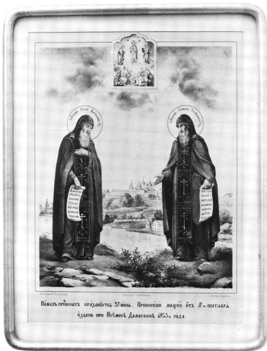
Fig. 5. V.M. Pesjehonov, Sergejs och Hermans ikon, 1853. OKM 860. Foto Vesa Takala. Ortodoxa kyrkomuseet.