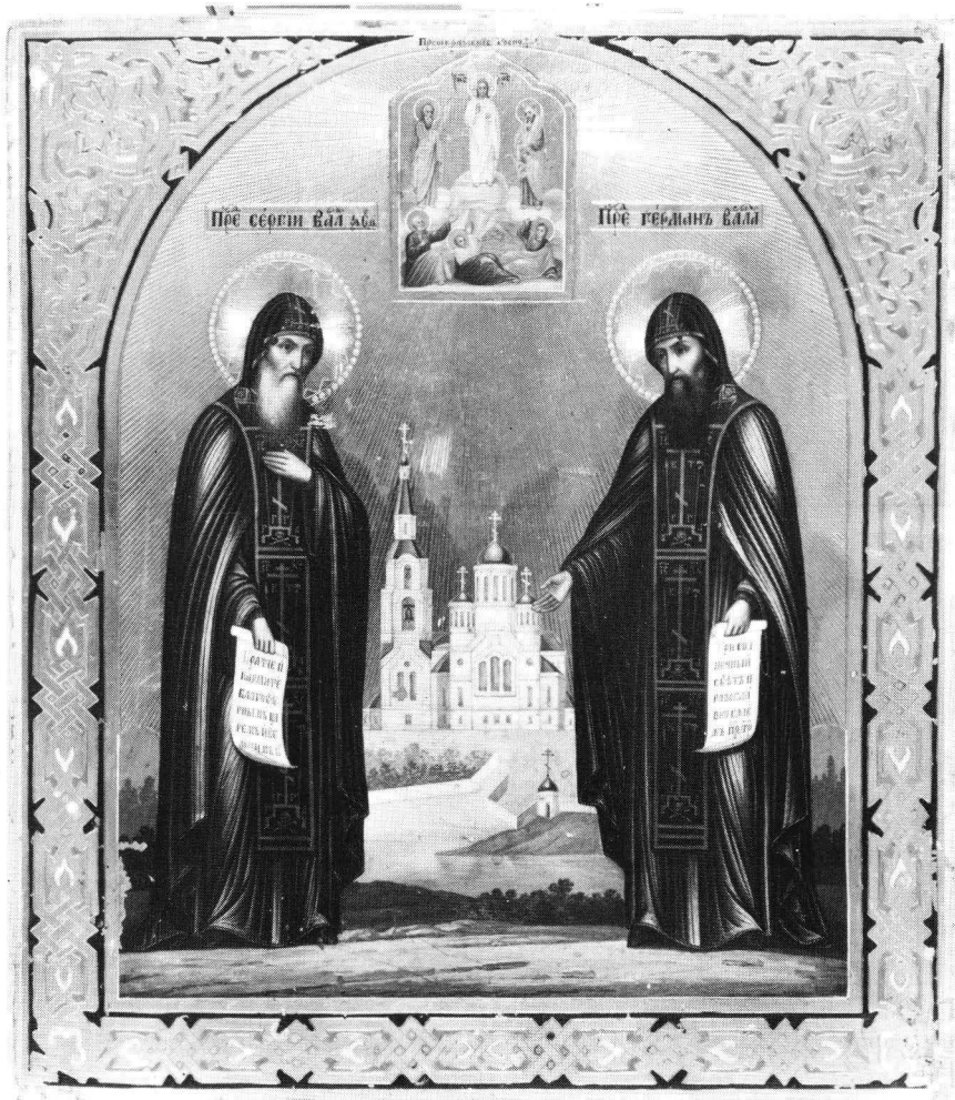
Fig. 1. Sergejs och Hermans ikon från slutet av 1800-talet. OKM 2219. Foto Vesa Takala. Ortodoxa kyrkomuseet.

De heliga fäderna i sina för skemamunkar typiska dräkter 6 uppfyller hela bildens förgrund, medan klostret avbildas centralt, men i bakgrunden. En sådan komposition är av relativt sent datum. Hagiografiskt uppstår den först på 1700-talet, och dess blomstringstid infaller på 1800-talet. 7 Tidigare, under medeltiden och i början av nya tiden, brukade man skildra klostergrundare enligt äldre modell en face och utan någon klostermiljö i bakgrunden.