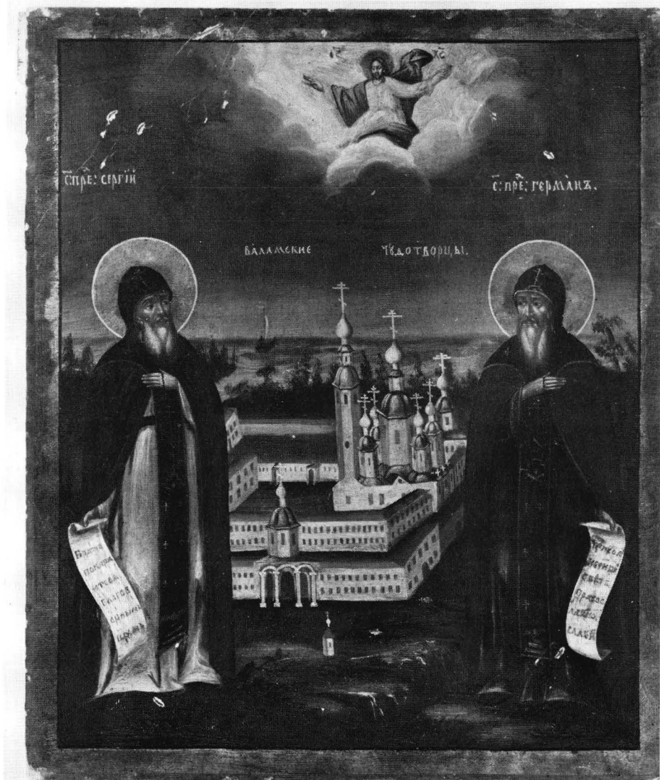
Fig. 4. På denna ikon av de heliga fäderna är uppmärksamheten betonad fäst vid den nyuppförda Heliga porten. OKM 1815. Foto Vesa Takala. Ortodoxa kyrkomuseet.

eldsvådor. Ett flertal sådana har antecknats i klostrets hävder, några uppkomna av våda, andra förorsakade av yttre fiender. Emellertid uppsteg klostret alltid på nytt, bokstavligen ur askan: nya kyrkor och bostäder uppfördes och inhägnader restes. 9