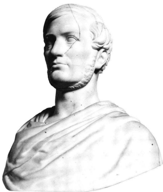
Fig. 2. M.A. Castrén. Marmorbyst gjord av den danske skulptören Jens Adolf Jerichau 1853. Ågare Helsingfors Universitet.

tiden blekt dem – men han var säkert redan märkt av den sjukdom han dukade under för följande vår.