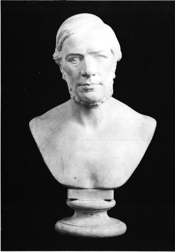
Fig. 8. M.A. Castrén. Gipsbyst av Valter Runeberg 1880. Ägare: Studentkåren vid Helsingfors universitet.