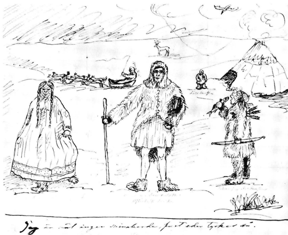
Fig. 10. Karrikatur ritad av M.A. Castrén under hans andra sibiriska resa. I mitten står han själv »sansculotte i ostjakisk frack» omgiven av »Storfursten och Storfrustinnan». I bakgrunden syns »Lillfursten» och Bergstadi som reser i väg med hundspann. Privat ägo.

Sailo hade i alla fall inte haft tillgång till Mebius fotografi. Matthias Alexander Castrén var vid sin död 38 år. På fotografiet som togs kort före hans död ser vi en man med stram hållning med ett värdigt och allvarligt uttryck. På skulpturen ser vi en gammal plussig hopsjunken man med en skinnmössa neddragen i pannan. På det slutliga förslaget ändrades sockeln så att han inte växer fram ur en klippa utan huvudet med pälskrage vilar på en sockel. Av politiska skäl upprestes inte bysten 1913. Efter många om och men skedde avtäckningen den 24. 6. 1921. Numera är monumentet gömt i ett yvigt buskage.