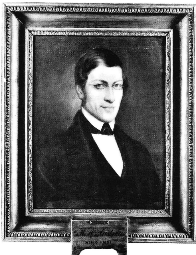
Fig. 4. M.A. Castrén. Oljemålning av G. Budkowski 1845. Ägare: Österbottniska delegationen.

naturlig storlek kostar 50 Rub.Silf. Jag nämner detta så utförligt om det fru professorskan sjelf må bestämma sig för hvilken som helst af ofvannämnda format hon behagar, att ett portrait uti naturlig storlek blir naturligast och prydligast talar af sig sjelf, ehuru dyrast.» 16