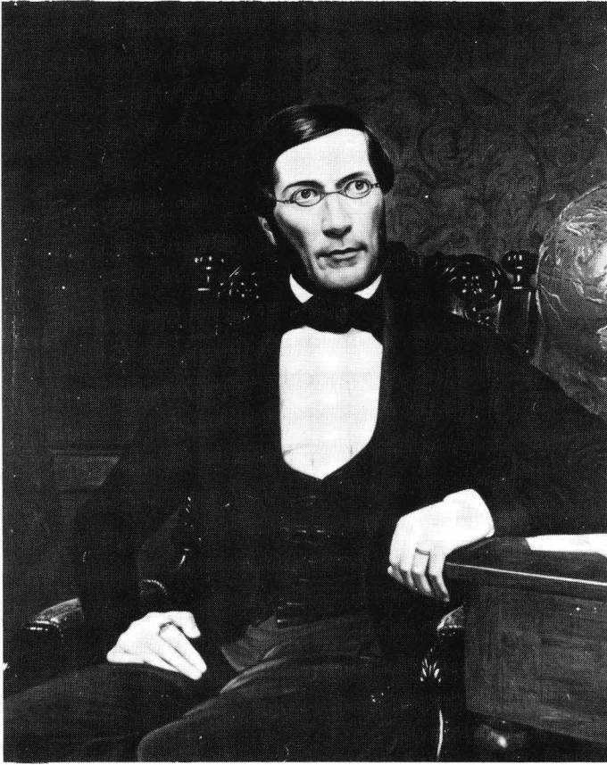
Fig. 5. M.A. Castrén. Oljemålning av R.W. Ekman 1853 efter Mebius fotografi. Ägare: Suomalaisen Kirjallisuuden Seura.

Jämför vi porträttet med fotografiet kan vi konstatera att Ekman verkligen följt fotografiet i minsta detalj. Ställningen är kanske något ledigare (fig. 5). Pelaren har blivit ett bord med bl.a. en jordglob där Asiens karta syns, till vänster på en hylla syns Kalevala och Runebergs verk. Castrén sitter i en stol med skulpterat ryggstöd mot en mönstrad tapet.