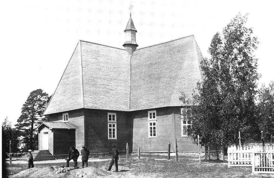
Björkö gamla kyrka, riven i början av 1900-talet. Foto Christian Ganderup 1898. Foto: Museiverket.

På wederbörig Kallelse har jag jemte Församlingens äldste infunnit mig här i Wiborg at taga denna dyra Gåfwan med al optänkelig wörnad emot. Första dag Pingst som