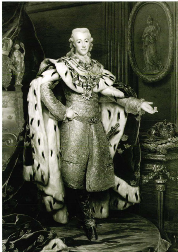
Detta paradporträtt av Gustav III målades 1777 av Alexander Roslin under kungens vistelse i S:t Petersburg, där Roslin vid denna tid befann sig. Sv Statens Porträttsamling no 660, Gripsholm.