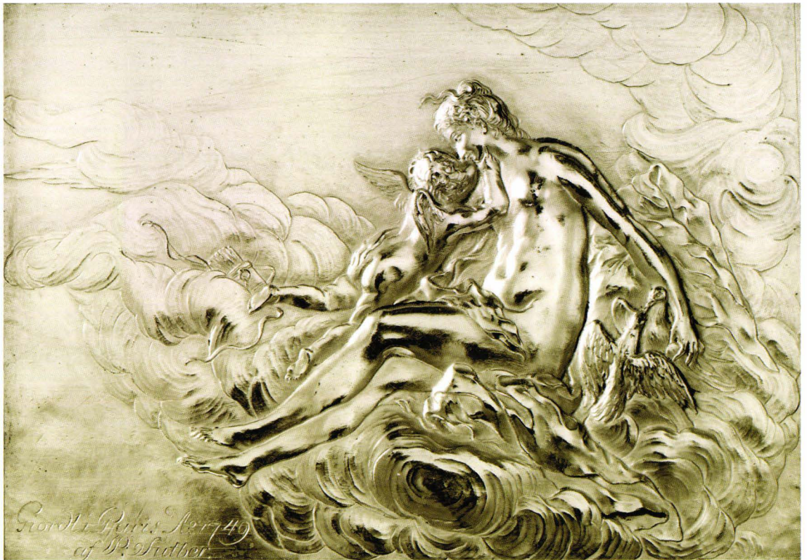
"Venus med sin son Cupido" Relief av förgylld mässing signerad Giordt i Paris A° 1749 af P Suther. 13x9,4 cm. Av Suther troligen använd som receptionsstycke till Konstakademien 1771. Nationalmuseum, Stockholm, Kbv 18/1985.

Pehr Suther förefaller att ha bedrivit sitt yrke som fri konstnär. Han sökte aldrig förening med guldsmedsämberet och hade därigenom sannolikt inte rättighet att bruka mästarstämpel och låta kontrollstämpla sina arbeten. 15 Kommerskollegium kunde likväl ge sådant tillstånd till hantverkare utanför ämbetet om dessa bedömdes som kvalificerade. Suther verkar dock inte ha begagnat sig av denna möjlighet. Då det jämlikt 1752 års kontrollstadga i princip var förbjudet att saluföra okontrollerade arbeten av ädelmetall