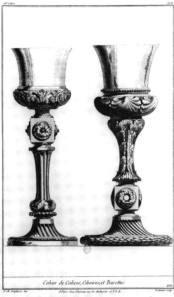
Två förslag till nattvardskalkar av Jean Charles Delafosse av vilka den t v använts som förlaga till Björkökalken. Ur Nouvelle Iconologie Historique ou Attributs Hiéroglyphiques... 2.ed Paris 1771. Bibioteque National, Paris.