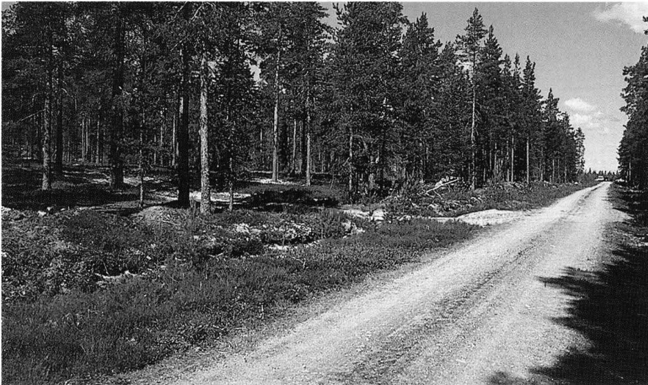
Till vänster om skogsvägen ligger en rad hyddbottnar, i slutet av vägen det stora utgrävnings- och sand-täktsområdet. Foto: Musciverket/ Vesa Laulumaa 1998.

Söder om det stora grustäktområdet och grävningarna på Rävåsen konstaterades ett trettiotal runda eller avlånga, låga fördjupningar i skogsmark. De kunde urskiljas på momark som vidsträckta svackor av regelbunden form och storlek, ca 5–10 m i diameter.