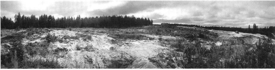
Boplatsoområdet avtorvat för sandtäkt före de arkeologiska undersökningarnas början, från norr. Foto: Museiverket/Simo Vanhatalo 1994.