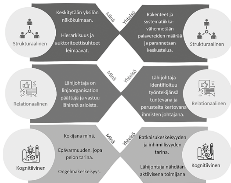
Kuvio 3. Sosiaalisen pääoman ulottuvuuksien erot haastatteluaineistossa

Aineistossamme (vuonna 2021) ennakoidaan, että etätyösuosituksen loppuessa ihmiset ainakin alkuun tulevat palaamaan toimistolle. Inhimillisyyttä ja kohtaamiset ovat kärsineet pandemia-ai- kana. Yhteenkuuluvuus, sitoutuminen ja henkinen panostus korostuvat epävirallisessa vuorovai- kutuksessa, jota siis etäpalaverissa on ollut vain vähän. Palavereita on paljon, mutta aitoa vuoro- vaikutusta vähän, mikä molemmissa tarinoissa yhdistettiin osallistumattomuuteen. Minäpuheessa asiaa kuvattiin enemmän oman pelon, epävarmuuden ja turhautumisen kautta, kun taas yhteisö- puheessa etsittiin syitä, miksi ihmiset vaikenevat. Tiivistämme Kuviossa 3 sosiaalisen pääoman ulottuvuuksien erot.