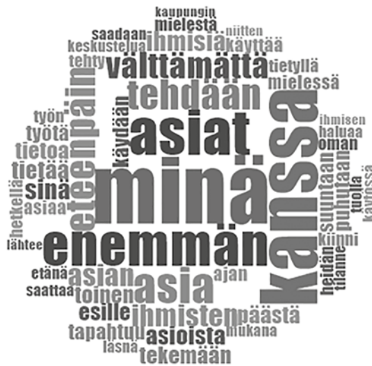
Kuvio 1. Johtaminen virtuaalisessa viitekehyksessä

Analyysimme aineistolähtöisessä osuudessa koodasimme Nvivo-ohjelmistolla koko aineiston kahteen pääkoodiin: johtaminen virtuaalisessa viitekehyksessä ja vuorovaikutus virtuaalisessa viitekehyksessä. Teimme näihin kahteen koodiin sanataajuus (word frequency) haun 50:lle eniten ilmenevälle sanalle.