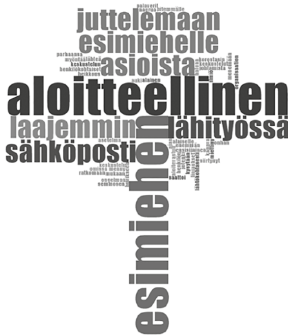
Kuvio 2. Vuorovaikutus virtuaalisessa viitekehyksessä

Tämän jälkeen jaoin aineiston kahteen luokkaan: minäpuheeseen painottuviin (myöh. minäpuhe) ja yhteisöpuheeseen painottuviin (myöh. yhteisöpuhe). Yhteisöpuheen nimitys juontuu aineiston myöhemmästä analysoinnista. Jako toteutettiin suorittamalla sanahaku kaikkiin haastatteluihin (mä OR mää OR minä OR minu* OR mun OR mulle OR musta). Jako tehtiin määrän perusteella ja rajaksi asetettiin 55. Minäpuheeseen painottuvissa haastatteluissa etsittyjä sanoja oli 55-193 kappaletta. Yhteisöpuheeseen painottuvissa etsityt sanat toistuivat 10-40 kertaa, mikä kertoo erilaisesta puheen näkökulmasta. Kaikissa haastatteluissa oli minäpuhetta, mutta tarkoituksenamme oli erottaa minäpuheeseen painottuvat haastattelut, joita oli seitsemän. Analyysissamme on näin ollen mukana seitsemän minäpuhetta sisältävää ja viisitoista yhteisöpuhetta sisältävää haastattelua. Vuorovaikutus virtuaalisessa toimintaympäristössä näyttää tiivistyvän puheeseen aloitteellisuudesta, jota analysoimme jäljempänä tulokissamme.