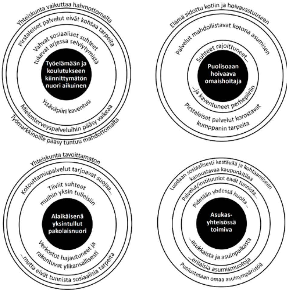
Kuvio 2: Eri ryhmillä, erilaisissa tilanteissa kehät voivat laajentua ja mahdollistaa osallisuutta tai ne voivat kutistua ja sulkeutua, jolloin muut kehät saattavat ylikorostua.

mäntilanteisiin liittyvää toimijuutta ja sen merkitystä ei tunnisteta. Yhteiskunnalliset käytännöt ohjaavat toimimaan marginaaleissa ja tarjoavat vain heikkoja kytköksiä yhteiskuntaan kiinnittymiseksi.