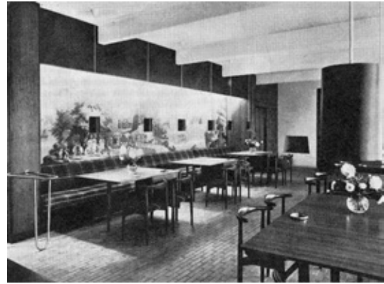
■ Kuva 3. Tanskan Carlsron kollektiivitalo. Kuva julkaistu Kaunis Koti -lehdessä vuonna 1966 (nro 2).