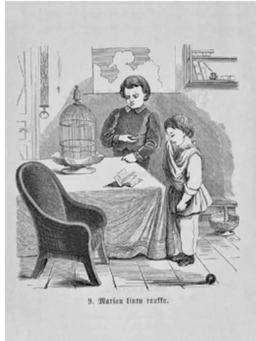
■ Kuva 3. Eläinteema nousi esiin myös myöhemmässä käännettyssä lastenkirjallisuudessa, kuten Cederwallerin kirjapainon painamassa kirjassa Huwigirja lapsuuskaisille vuodelta 1864.

Toisaalta tunteiden historian parissa on yhdistetty moraalista tunteista käyty keskustelu Ranskan suuren vallankumouksen vaikutuksiin 1800-luvun vaihteen Euroopassa. Vallankumous oli merkinnyt toisaalta ihmiskeskeisten käsitteiden läpimurtoa mutta myös pettymystä ja epäilyjä, että moraaliset tunteet eivät olleetkaan niin luonnollisia ja myötäsyttyisiä kuin aiemmin oli oletettu. Samaan aikaan kun ihmisyyden ja myötätunto nousivat uudella tapaa keskeisiksi moraalia ohjaaviksi käsitteiksi, painotettiin niiden kehityksen ennen kaikkea kasvatuksen myötä, ja koros-