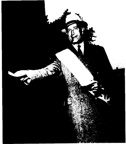
Kansanpuolueen puheenjohtaja Bertil Ohlin ja- kamassa vaalilippuja toisen kamarin vaaleissa tuhholmalaisen äänestyspaikan ulkopuolella 1952.

Ruotsalaisessa yhteiskunnassa sosiaalide- mokraatit määräsivät nyt yhteiskunnan ke-