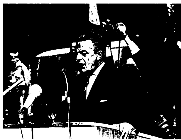
Martti Virkkunen aloitti kokoomuksen presidentinvaalitaistelun Seinäjoella elokuussa 1967.

oli jatkunut jopa niin pitkälle, että markkinataloudesta ei puhunut edes remonttimieskokoomus. 56