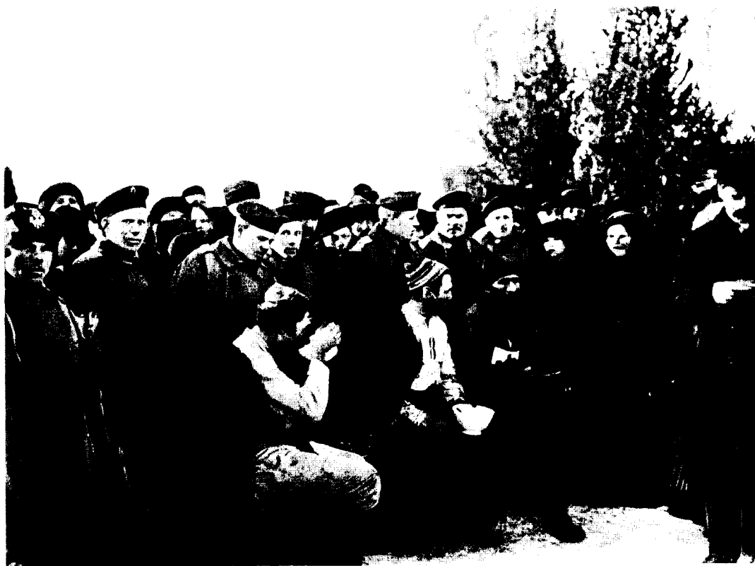
Kilpabiibtäjiä 1890-luvulla. Kuva on julkaistu I. K. Inhan teoksessa "Suomi kuvissa" (1896).

järjestettiin korostamaan kreikkalaisuuden erinomaisuutta. 13 Olympiakisoja käytettiinkin 1800-luvun jälkimmäisellä puoliskolla synonyyminä isohkolle amatööriurheilutapahtumalle eikä sillä ollut vielä nimenomaista kansojen välisen kilpailun merkitystä.