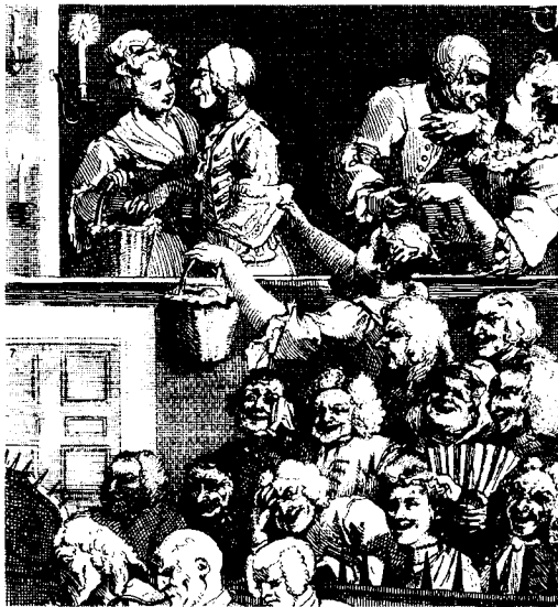
Englantilainen satiiri otti maalitaulukseen bienoston mannermaisat tavat. Huomaa kontrasti aition ilottoman muodollisuuden ja permannon vapautuneen naurun välillä. William Hogarth, The Laughing Audience (1733).

Yksityisyyden sulkeistaminen on kohteliaan seurallisuuden keskeinen aksioma. Hän kirjoittaa pojalleen: