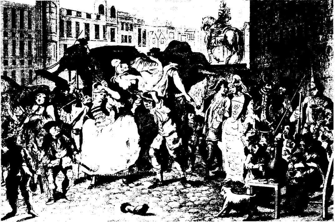
Suurkaupungin hämmentävä moneus vaati käyttäytymisen koodien uudelleenmäärittelyä. L. P. Boitard, The Charing Cross Evening Frolic (1756).

nointisi opettaa sinua enemmän kuin mihin minä pystyn. Tee siten kuin tahdot sinulle tehtävän on varmin menetelmä mitä miellyttämiseen tulee. Havainnoi tarkkaan, mikä muissa miellyttää sinua, ja mahdollisesti samat seikat sinussa miellyttävät muita. Jos sinua miellyttää toisten rakastettavuus ja huomaavaisuus sinun mielenlaatuasi, makuasi tai heikkouksiasi kohtaan, luota siihen, sama rakastettavuus ja huomaavaisuus sinun taholtasi heitä kohtaan miellyttää heitä.”