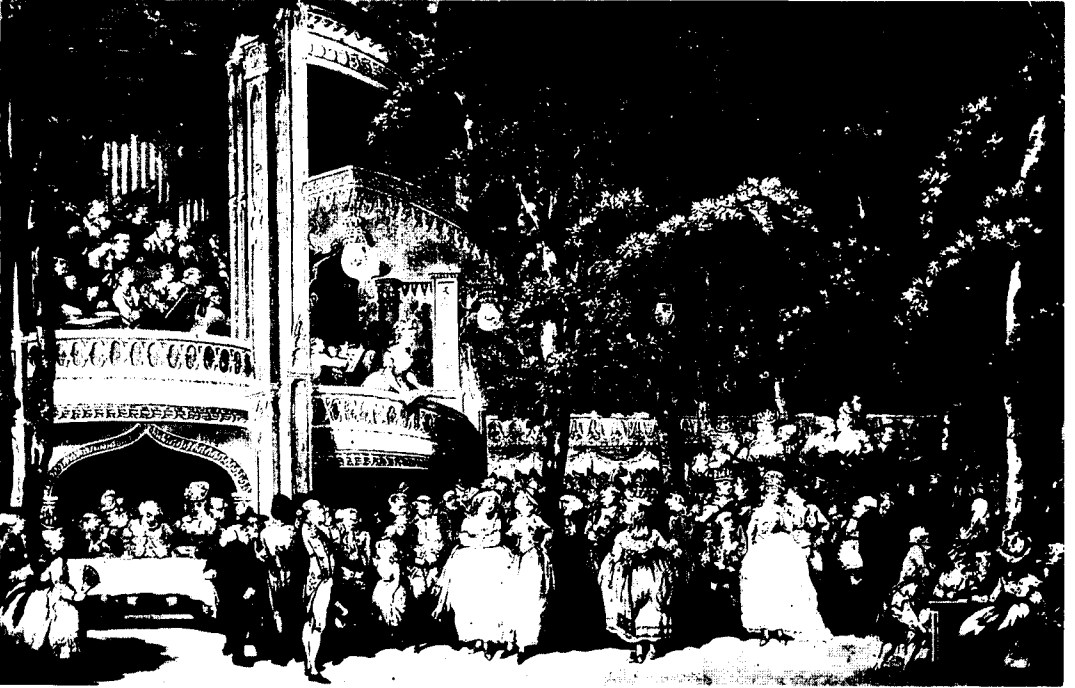
Kabviloiden ja huvipuistojen seurallisuudessa yhdistyi anonyymi kohteliaisuus sosiaaliseen kirjavuuteen. Thomas Rowlandson, Vauxhall Gardens (1784).

dän seurassaan, he ovat vapautuneita minun seurassani; osaan heidän kieltään, ja keskustelemalla heidän kanssaan opin tuntemaan heidän luonteensa, hän vastaa. 20 Tunteuttomien kanssaihminen luonteita tulee herkeämättä tarkkailla, heidän tapojaan opiskella, kuunnella heidän tuntemuksiaan ja mielipiteitään sekä keskinäisen miellyttämisen periaatetta noudattaen sopeuttaa oma käyttäytyminen niihin.