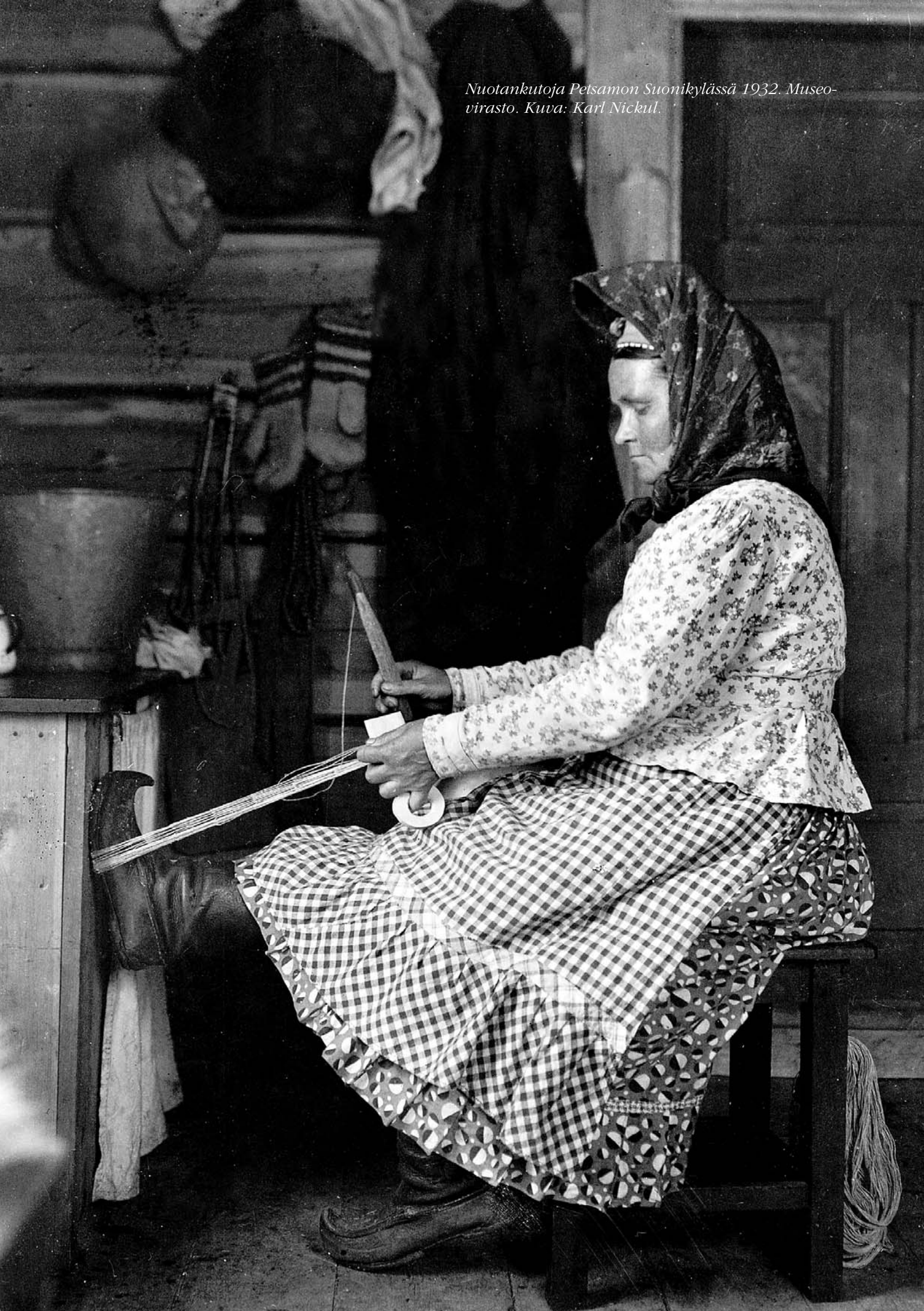
Nuotankutoja Petsamon Suonikylässä 1932.