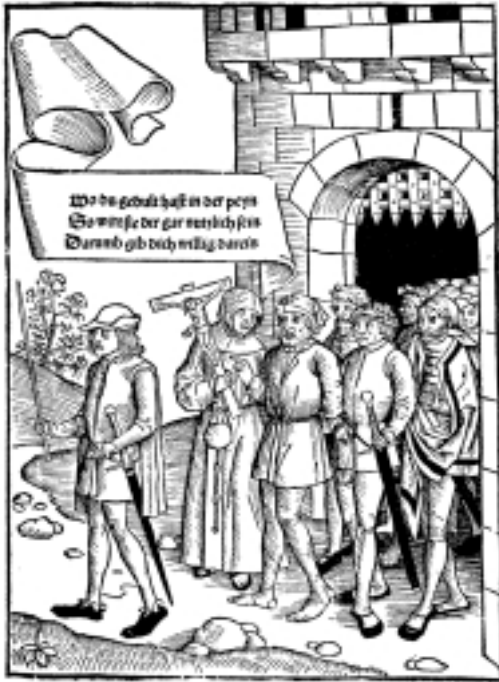
Kirkonmies opastaa kuolemaan tuomittua rikollista kestämään ruumiilliset tuskat sielun pelastuksen vuoksi. 1500-luvun alun puupiirros teoksessa Kobler & Scheel (toim.), Die Bambergische Halsgerichtsordnung, Halle (1902).

lisessa muodossa ja myös oikeusprosessin kulun kirjasi kirjuri tarkoin muistiin. 8