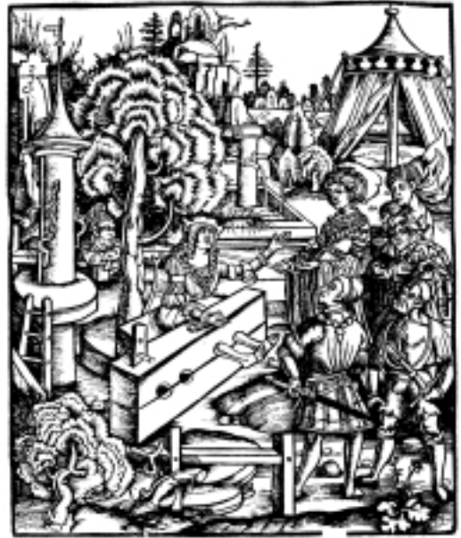
Mies julkisesti jalkapuussa ihmisten pilkattavana. Vieressä häpeäpaalu. Puupiirros vuodelta 1538 teoksessa Wolfgang Schild, Alte Gerichtsbarkeit. Vom Gottesurteil bis zum Beginn der modernen Rechtsprechung , München (1980).

Oikeudenkäynti tähtäsi tunnustukseen ja sen saamiseksi käytettiin kahta keinoa: syy- tetyn valaa ja kidutuskuulustelua. Prosessi jakaantui viranomaisten salaiseen tutkimuk- seen ja syytetyn rituaaliseen tunnustukseen, sekä rangaistuksen täytäntöön panemi- seen. 15 Kidutus valtion ja kirkon hyväksy- mänä oikeuskeinona mahdollisti oikeuden- palvelijoiden henkilökohtaisten sadististen tai kostonhaluisten mieltymysten toteutta- misen. Se ei kuitenkaan ollut rangaistus vaan kuulustelumenetelmä. Yleisesti nou- datettiin kolmea vaihetta. Ensimmäinen in- strumentit esille ja näytettiin ne syytetylle. Usein tämä jo johti toivottuun lopputulok- seen eli tunnustukseen. Mikäli syytetty edel- leen vaikenä tai väitti vastaan, siirryttiin vai- heeseen kaksi, joka oli alasti riisuminen ja kidutuslaitteisiin, seinään tai paluun kiin- nittäminen. Alastomuuden häpeällisyys ja tilanteen uhkaavuus toimivat yleensä tehok- kaasti. Jos syytetty ei tästä huolimatta tun- nustanut, siirryttiin varsinaiseen kidutuk- seen eli fyysisen tuskan tuottamiseen. 16