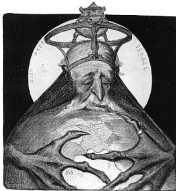
Juutalaisten ja rahavallan yhteys nähtiin 1800-luvulla konkreettisimpänä Rothschildin pankkiriisuvussa. Kuvassa maailmaa tiukassa otteessaan pitävä paroni Alphonse James de Rothschild (1827–1905). C. L. Léandren piirros vuodelta 1898.

Uudella ajalla vakiintuneen stereotypian mukaan juutalainen oli tunnoton koronkiskuri ja petollinen rahanvaihtaja sekä tämän ohella myös omahyväinen saituri. Juutalainen oli häikäilemätön liikemies, kapitalismin airut. Varmasti vaikuttavammin tämä hahmo on kristallisoitunut maailmankirjallisuuden tunnetuimmassa juutalaihahmossa, William Shakespearen Venetsian kauppiaan Shylockissa. Kristityltä kauppiaalta velkansa pantiksi naulan kauppiaan omaa lihaa vaatinut ahne Shylock antoi uuden ajan tunnottomalle juutalaiselle rahamiehelle ihmisen kasvot. Raha oli juutalaisten jumala. Tälle perustalle rakentui myös uusim-