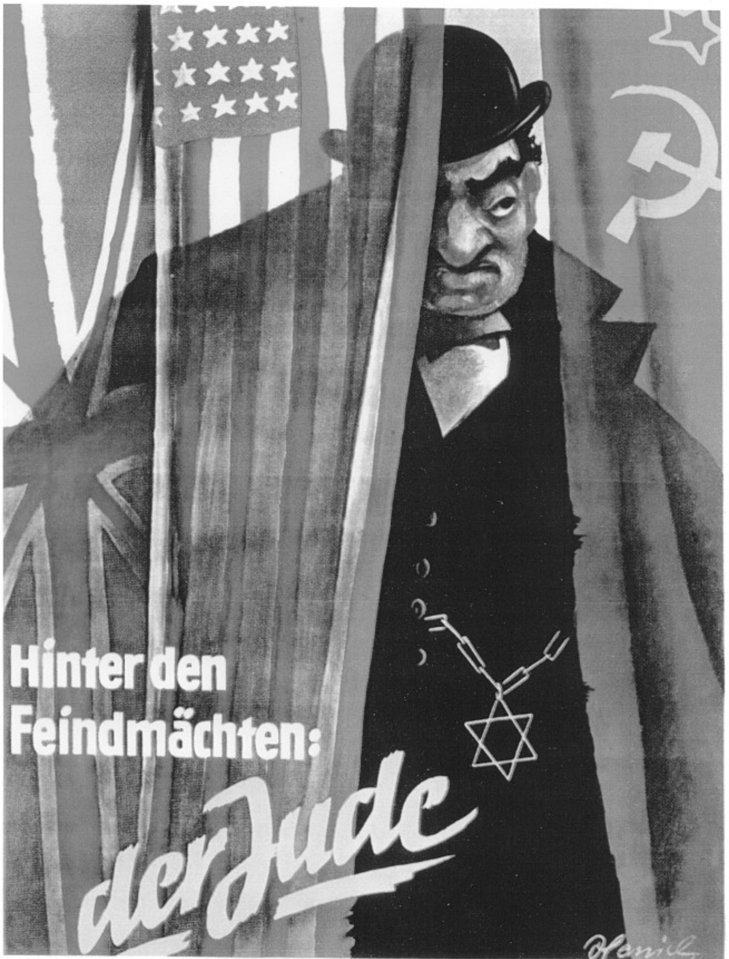
"Vihollisvaltojen takana: juutalainen." Saksalainen juliste toisen maailmansodan vuosilta. Sitä levi- tettiin erikielisinä laajemminkin Kolmannen valtakunnan valtapiiriin.