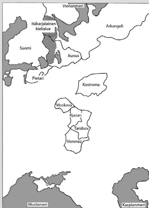
Itä-Karjalan ballinnollinen aluejako noin vuonna 1900 ja vertailualueiden sijanti.

Lähteet: Czap (1978); Czap (1983); Worobec (1991) 108–115; Pöllä (2001), 617.