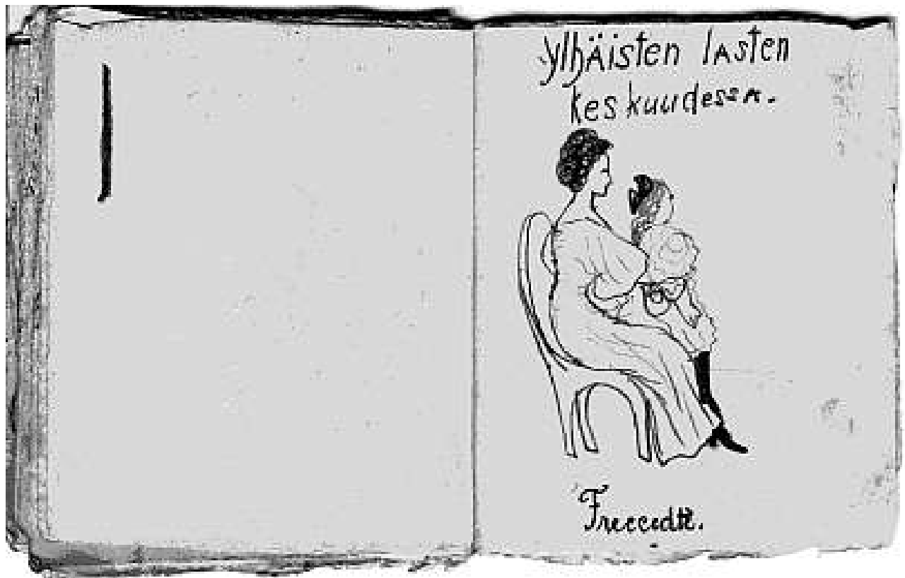
Aukeama Lemminkäisen tyttöjen nimettömästä pikkuvihkosta 1910-luvulta.