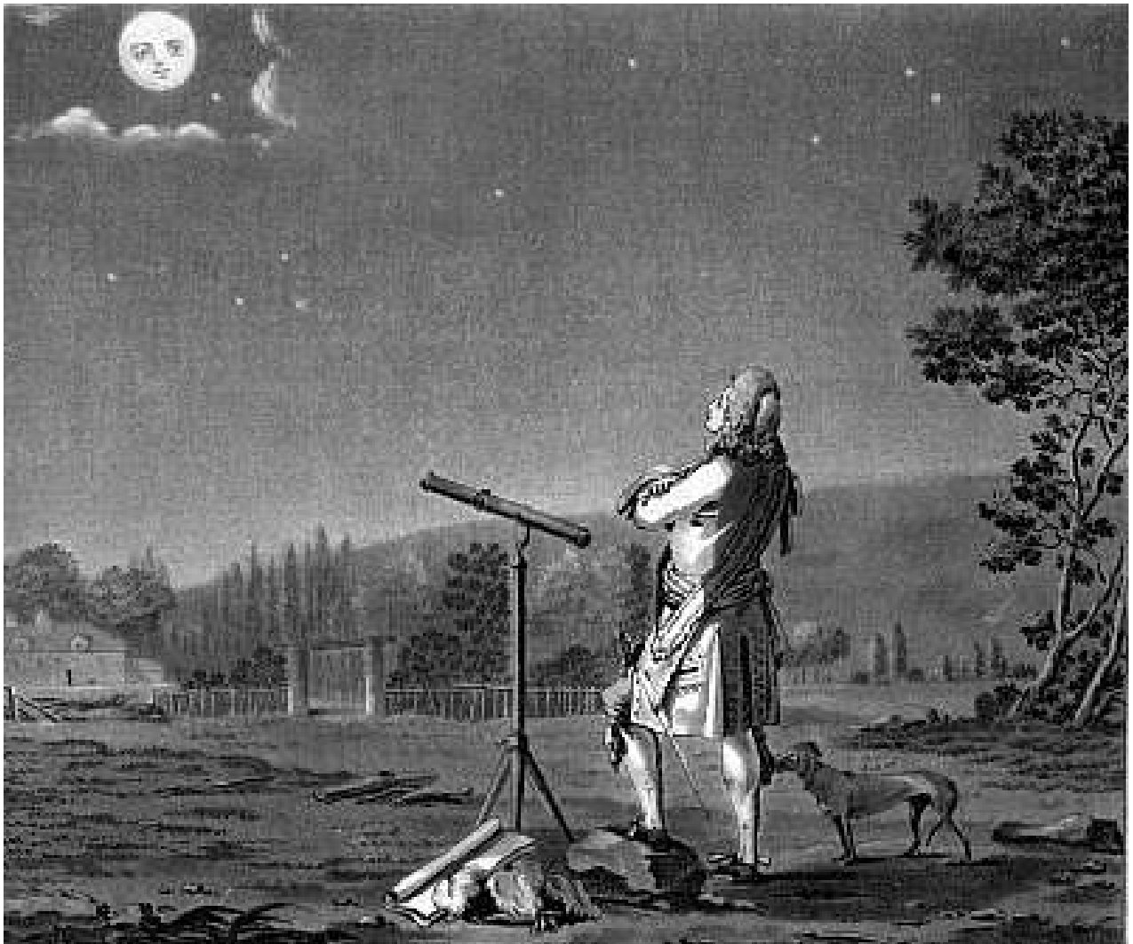
Ranskan tiedeakatemian sihteeri Bernard le Bovier de Fontenelle mietiskelee maailmojen moninaisuutta. Värikaiverrus J. F. J. Swebachin mukaan 1700-luvulta.

kaikkeudesta. 25 Uusimmassa amerikkalaisessa keskustelussa maailmankuva on kytkeyty yhä tiiviimmin kristinuskon oppeihin. Siinä ihmisen tietoisuuden keskuksiksi ja samalla maailmankuvan määrittäjäksi on nostettu raamatullinen ”sydän”. Maailmankuva on symbolien ketju, joka määrittelee elämän tarkoitusta. 26