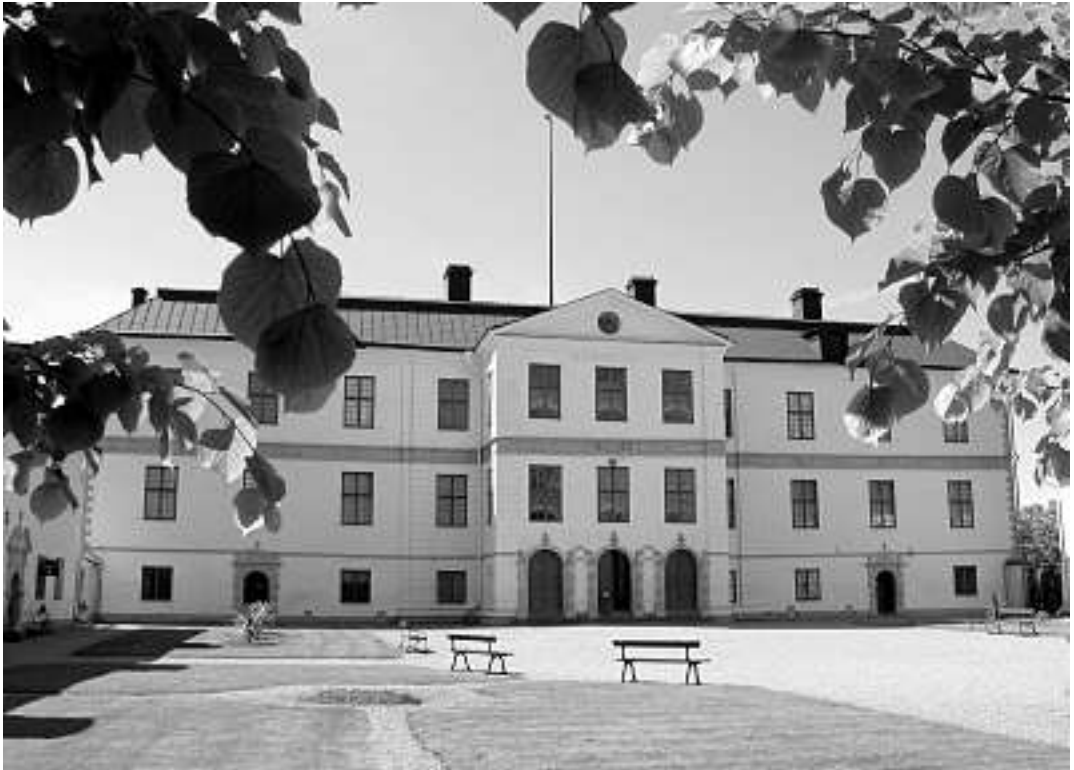
Löfstadin linna. Axel von Fersen ja Hedvig De la Gardien kunnostivat tulipalosta kärsineen suurvalta-ajan linnan uudenaikaiseksi aatelispalatsiksi 1750-luvulla. Linnaan rakennettiin keittiö ja ruokasali, ja sisustus uusittiin vastaamaan aikakauden ihanteita ja mukavuuskäsityksiä kaakeliuuneineen ja kaksinkertaisine ikkunoineen.

Ruotsin eturivin arkkitehdit saivat kouluksensa Ranskassa ja heidän piirtämänsä aatelispalatsit ja maaseutukartanot sekä kuninkaalliset linnat noudattivat ranskalaista ihannetta. Yli kymmenen vuotta Ranskassa upseerina palvellut Axel von Fersen tunsikin uudet arkkitehtoniset virtaukset ja palkkasi Ranskassa ja Italiassa opiskelleen yli-intendentti Carl Härlemanin arkkitehdiksi korjauttaessaan 1750- ja 1760-luvulla säädynmukaiseksi aatelispalatsiksi 1600-luvun alkupuolella rakennetun Tukholman talonsa. Talon korjauttamisen lisäksi Fersen rakennutti tontilleen kahdentoista hevosen tallin, vaunuvajan, leivin- ja panimotuvan, mankelihuoneen ja varastoja, joiden yläkertaan tuli palvelijahuoneita. Kadunvarteen rakennettiin myös pitkä siipirakennus, johon tuli vuokrattavia myymälä- ja asuintiloja. 42 Fersenien kaupunkitalot ja useat linnat maaseudulla oli kaikki rakennettu ja sisustettu samaan tapaan: kreivittären ja kreivin