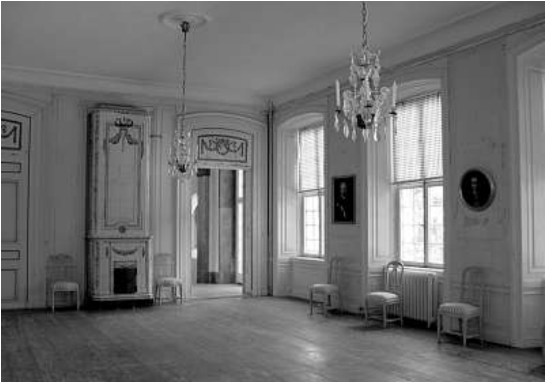
Ljungin linnan ruokasali, johon alunperin ripustettiin sukumuotokuvia kabteen riviin seinille. Kun ruokasalia ei käytetty, sujoitettiin tuolit vasten seinää ja suuret klaffipöydät siirrettiin viereiseen käytävään.