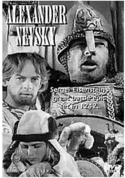
Aleksanteri Nevski -elokuvan (1938) juliste. Ohjaaja: Sergei Eisenstein.

Herää kysymys, miksi kuitenkin nimenomaan Pyhä Aleksanteri ”ohitti” monia parempia ehdokkaita, miksi nimenomaan hänet ”määriteltiin” kaikkein suurimmaksi venäläiseksi? Nähdäkseni syitä on kolme: Aleksanteria pidetään menestyksekkäänä taistelijana länttä vastaan, 53 hän on pyhimys, joka kanonisoitiin jo Iivana Julman aikana; ja Aleksanteri Nevskin ”uuden ajan” myytti, jonka mukaan nykyvenäläiset käsittävät hänen hahmonsaa, luotiin Stalinin aikana ja se on tiiviisti sidottu voittoon Suuressa Isänmaallisessa sodassa. 54 Aleksanteri Nevskin historiallinen merkitys kasvoi Venäjän historian eri vaiheissa; Iivana Julman, Pietari Suuren sekä Stalinin kausina, ja joka kerta hänen roolinsa maan pelastajana läntiseltä ekspansiolta ja ortodoksisen uskon suojelijana kasvoi ja selkiytyi. 55 Stalinin aikana Sergei Eizenstein loi kulttielokuvan Aleksanteri Nevski (1938), joka teki hänestä eepisen sankarin korostaen hänen uskollisuuttaan kotimaalleen. Suuren Isänmaallisen sodan alkaessa elokuvaa esitettiin laajalti ja sen luojat saivat Stalinin palkinnon. Vuonna 1942 perustettiin Aleksanteri Nevskin kunniamerkki. Kun vuonna 1943 Stalin kääntyi ortodoksisen kirkon puoleen ja