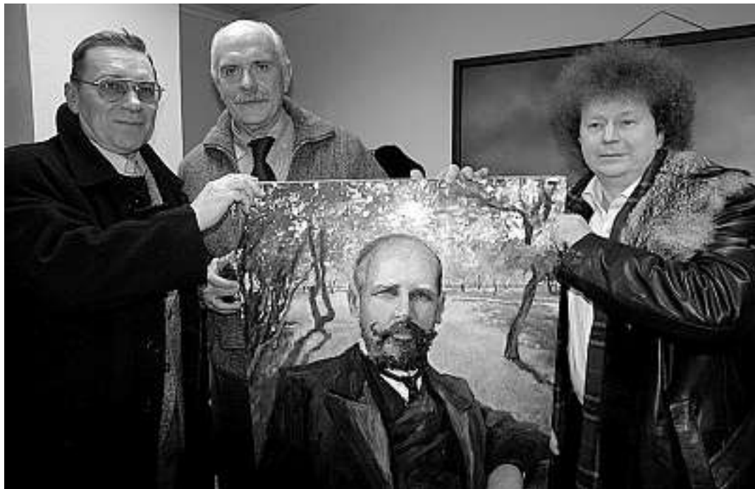
Nikita Mihalkov (keskellä) esittelee Pjotr Stolypinin muotokuva.

niä auttoi menestykseen kolmannella kieroksella (toinen sija) hänen esittelijänsä, lahjakkaan näyttelijä Nikita Mihalkovin innostusta herättänyt puhe. 41 Mihalkov on Venäjällä kuuluisa henkilö, näyttelijä, elokuvaohjaaja sekä erittäin aktiivinen yhteiskunnallinen vaikuttaja 42 ja Vladimir Putinin suosikki. 43 Voi epärommasti sanoa, että Stolypinin kuvauksessaan Mihalkov toimi vallan äänitorvena. Puheessaan hän teki Nikolai II:n ajan kyvykkästä ja tarmokkaasta virkamiehestä eepin hahmon, henkilön, joka yksin olisi voinut muuttaa koko Venäjän historiaa.