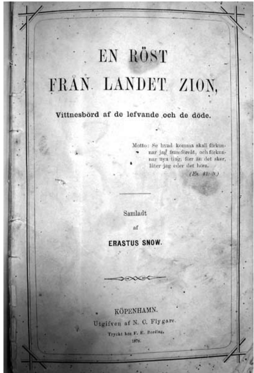
Mormonilehtinen En röst från landet Zion. Kansallisarkisto.

salaista mormonilehti Nordstjernania ja opillisia perusteoksia joillekin ihmisille. 28 Lisäksi Pohjassa oli liikkeellä käännytyskirjallisuudeksi luokiteltavia lehtisiä En röst från landet Zion ja En sannings röst till de uppriktiga af hjertat . 29 Blom oli yhtäältä tarjonnut tällaista kirjallisuutta ihmisille, toisaalta jotkut olivat pyytäneet sitä häneltä.