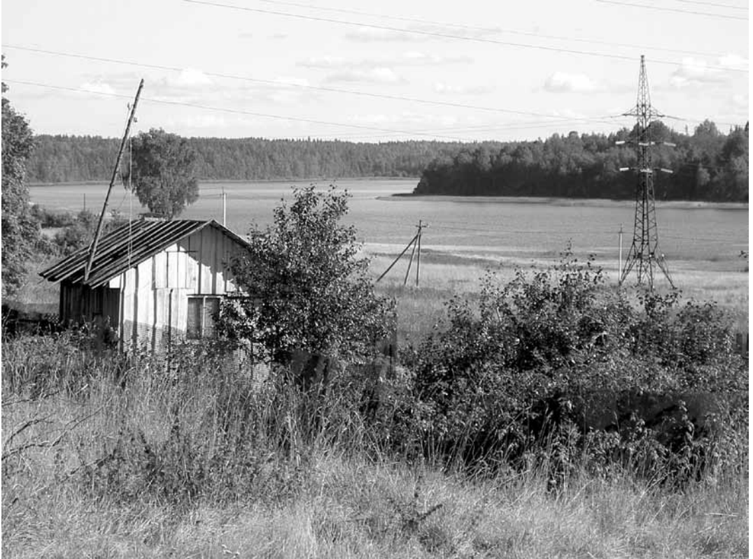
Vuoksen varren kulttuurimaisemaa entisen Antrean, nykyisen Kamennogorskin alueella syyskuussa 2005.

joka koskilla, saarilla ja koko jokimaisemalla on ollut Vuoksen varrella asuneille.