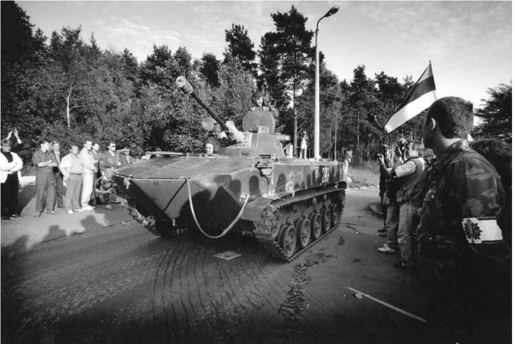
Neuvostoliiton armeijan joukot vetäytyvät Tallinnan televisiotornin luota 24.8.1991.

muodostui uuden Viron henkiseksi perustaksi. Elokuussa 1991 Viro palautti itsenäisyytensä sen sijaan, että olisi julistettu uusi itsenäisyys. Käsitukset historiasta olivat tämän päätöksen kannalta keskeisessä roolissa. Muinaismuistoseuran toiminta osoittaa konkreettisesti historian tulkitsemisen poliittisen luonteen.