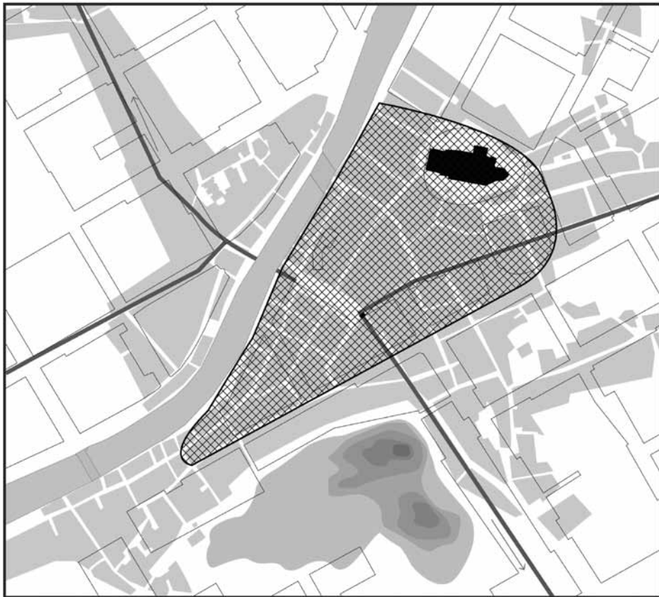
Markus Hiekkasen tulkinta Turun kaupungin varhaisvaiheesta (2002)