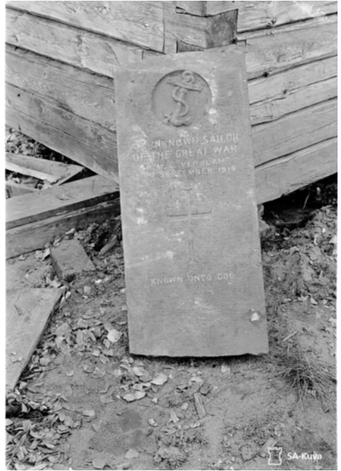
Kuva 1. New Yorkiin toimitettu, neuvostoliittolaisten häpäisemää Venäjän sisällissotaan valkoisten puolella osallistuneiden brittiläisten merisotilaiden hautaa Seivästöllä esittävä valokuva.

Isoon-Britanniaan ensimmäiset kuvat toimitettiin raporttien mukaan vasta huhtikuussa 1944. Ennen Ison-Britannian sodanjulistusta joulukuussa 1941 maahan ei olisi siis toimitettu yhtään kuvaa, mitä on vaikea uskoa. On siis olemassa viitteitä siitä, että kaikkia levitettyjä kuvia