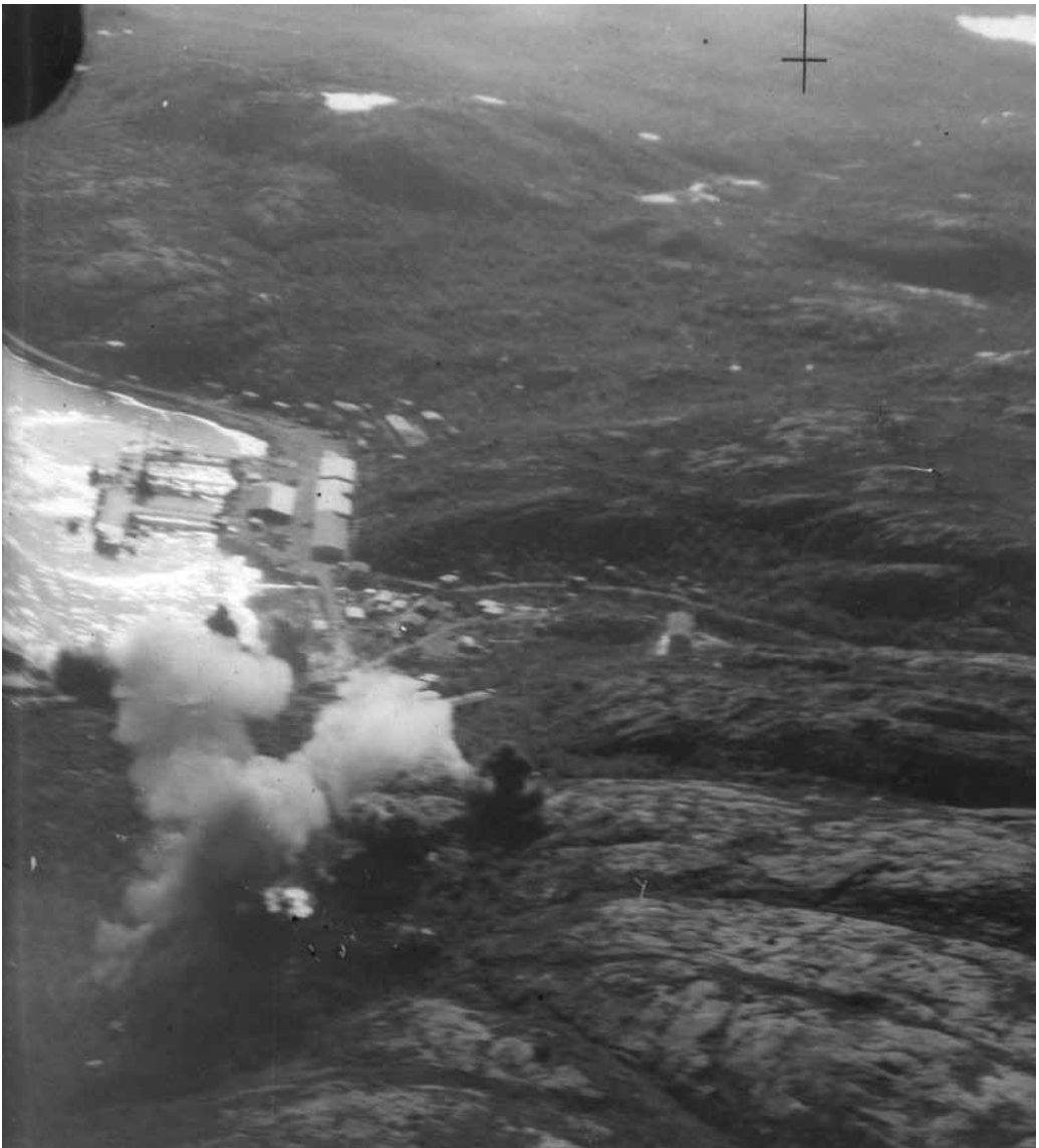
Kuva 3. Torpedo-osumat kohti laituria no 2. Pommit tiellä, joka johtaa laivankorjaustelakalle. Pommit rinteessä.

din vastaukset eivät nähtävästi täysin tyydyttäneet pääministeriä, koska tämä hoputti Poundia ja antoi hänelle määräyksiä terävään ja jonkin verran ärtyneeseen sävyyn.” Maiski ja Churchill keskustelivat myös Iranista. Churchill sanoi, että jos šaahi on peräänantamaton, hän katsoo tarpeelliseksi toteuttaa Iranin sotilasmiehityksen englantilais-neuvostoliittolaisilla voimilla, ja siinä