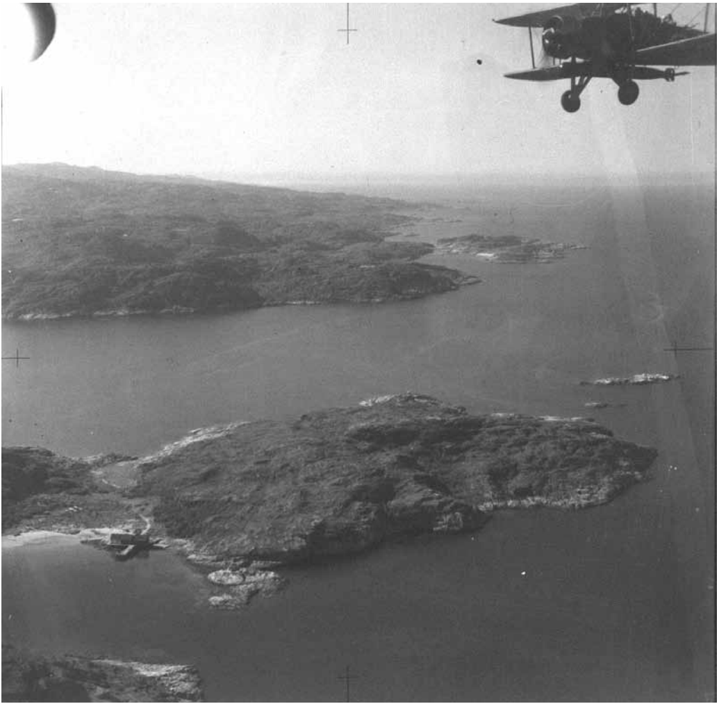
Kuva 2. Petsamonvuonon suu idästä länteen. Etualalla Numeroniemi, taka-alalla Etelamukka [kuvattu noin 7 kilometriä eli 2 minuuttia ennen määräpaikkaa].

neista tapaamisista kertovat Neuvostoliiton ulkoasiainkansankomissariaatin eli Narkomindelin pöytäkirjat, jotka ovat yksityiskohtaisempia lähteitä kuin brittien Lontooseen lähettämät sähköteet. Niistä käy selvästi ilmi, että tuoreilla liittolaisilla oli hyvin toisistaan eroavat käsitykset siitä, miten Ison-Britannian sotilaallisesta avusta Petsamon ja Murmanskin alueella pitäisi sopia. Molotovin mielestä kysymys oli vain Ison-Britannian hallituksen periaatteellisesta päätöksestä ja siksi mitään yksityiskohtaisempaa sotilaallista