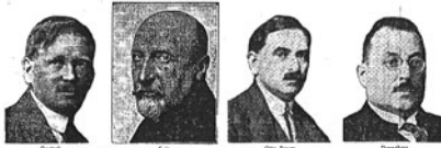
Eduskunnan puheenjohtaja, kansanedustaja Antti Kallio . Eduskunnan puheenjohtaja, kansanedustaja Yrjö Järvelin . Eduskunnan puheenjohtaja, kansanedustaja Yrjö Järvelin . Eduskunnan puheenjohtaja, kansanedustaja Yrjö Järvelin .