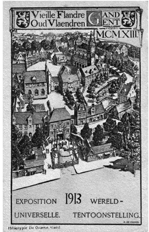
■ Kuva 6. Gentin maailmannäyttelyn 1913 yhteydessä pidettiin ensimmäinen kunnalliskonferenssi, joka kokosi yhteen yli 400 edustajaa 23 maasta ja 162 kaupunkikunnasta. Konferenssissa perustettiin kunnallisanal kansainvälinen keskusliitto L'Union International des Villes / International Union of Local Authorities (UIV/IULA) . Sen toiminta pääsi todellisuudessa alkamaan vasta ensimmäisen maailmansodan päätyttyä. Lähde: http://users.telenet.be/stardegraeve/expo%20universelle%201913.html .

Kunnallisen yhteenliittymisen aate tihkui kuitenkin Ehrnroothin näkemyksessä. Ratkaisu haasteisiin oli kaupunkikuntien välinen yhteistyö ja kansainvälisistä esikuvista oppiminen. 58