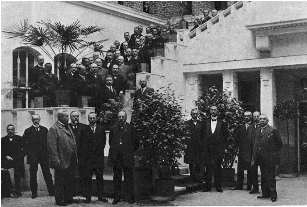
I STADSMÖTET I HELSINGFORS ÅR 1912.

matta. Se jäi vanhan vallankäyttäjän, porvariston, käsiin. Tärkein tehtävä oli löytää uusia toimintamuotoja. 25