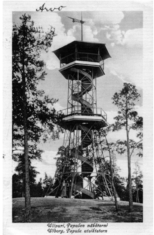
Kuva 3. Kunnallispuistot toivat näkötornit ja 360 asteen laajuiset maisemat kansan ulottuville. Kuvassa vuonna 1905 Viipuriin Papulan kansanpuiston pystytetty Pilipuu-niminen näkötorni. Rautainen torni tuhoutui toisessa maailmansodassa.

Ihmiset halusivat luontoon, koska kuivalla, ylävällä maaperällä, havumetsillä, metsämarjoilla, sienillä, laululinnuilla ja luonnonkauneudella katsottiin olevan myönteisiä terveysvaikutuksia. 65 Oleellinen ero keskustapuistoihin oli se, että kunnallispuistoissa saattoi tarvittaessa oikaista levele ja rentoutua. Kunnallispuistoissa sai käyskennellä vapaasti tai varta vasten maastoon rakennettuja polkuja tai puistoteitä pitkin. Puistoissa oli lähes aina uimaranta tai erillinen uimala hyppytorneineen ja joskus myös saunoja. Talviurheilua varten urheiluseurat ja kunnat rakensivat niihin hiihtolatuja, kelkkämäkiä tai mäenlaskupaikkoja. Ainakin Riihimäen Riuttan harju- ja suppa-alueelle sekä Porvoon Kokonniemen kansanpuiston läheisyyteen raivattiin 1950-luvulla laskettelumäki hiihto-hisseineen. 66 Useimmiten käytettävissä oli myös kaivo ja käymäläpalvelut. Joihinkin vedettiin myös vesijohtoja ja viemäreitä, jotka mahdollistivat kioski-, kahvila- tai ravintolapalvelujen tarjoamisen. Parissa kunnallispuistoissa oli tarjolla majoituspalvelujakin. 67 Varustelun ja palvelujen taso riippui kunkin kunnallispuiston perustamisajankohdasta, tarkoituksesta ja käyttäjämäärästä.